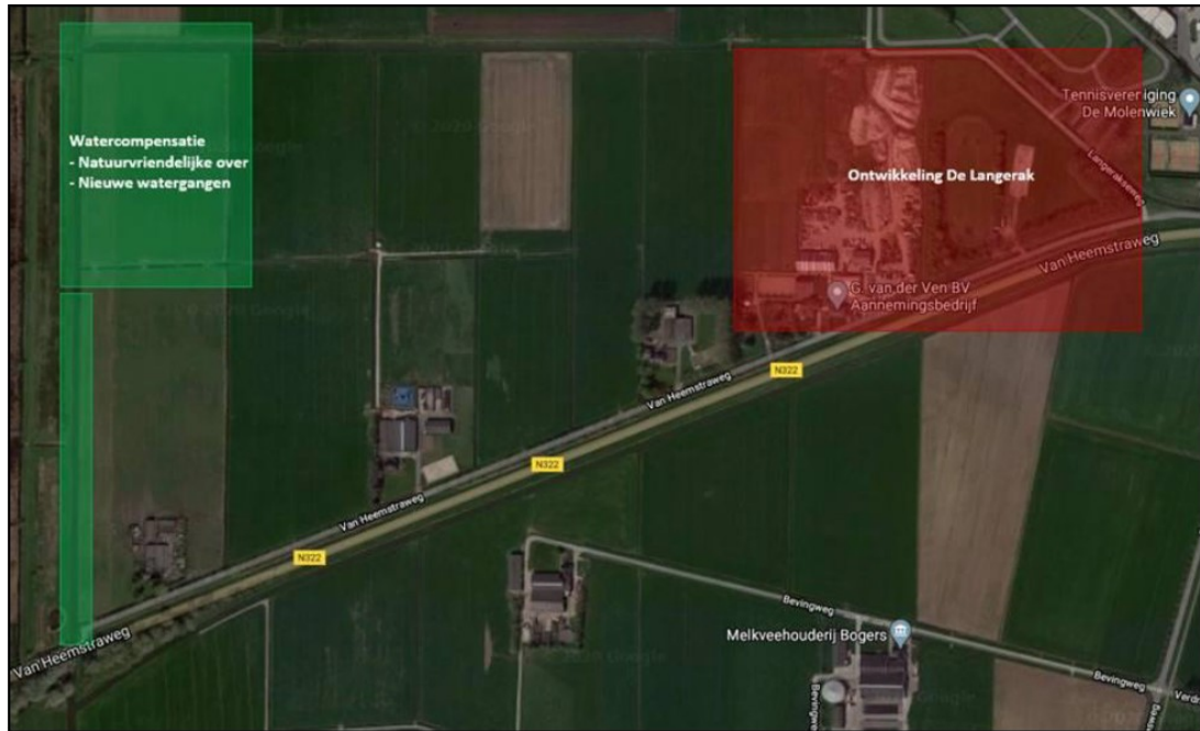
Figuur 3 Ligging compensatiegebied (groene arcering). De locatie van het watercompensatiegebied 800 m ten westen van de planlocatie, zal ook functioneren als alternatief leefgebied van de poelkikker