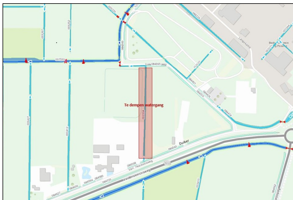
Figuur 2 Te dempen watergang..