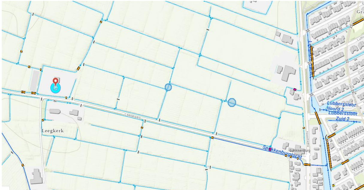
Figuur 2: Locatie van werkzaamheden. De blauwe cirkels geven de locatie weer van de aan te leggen dammen met duiker.