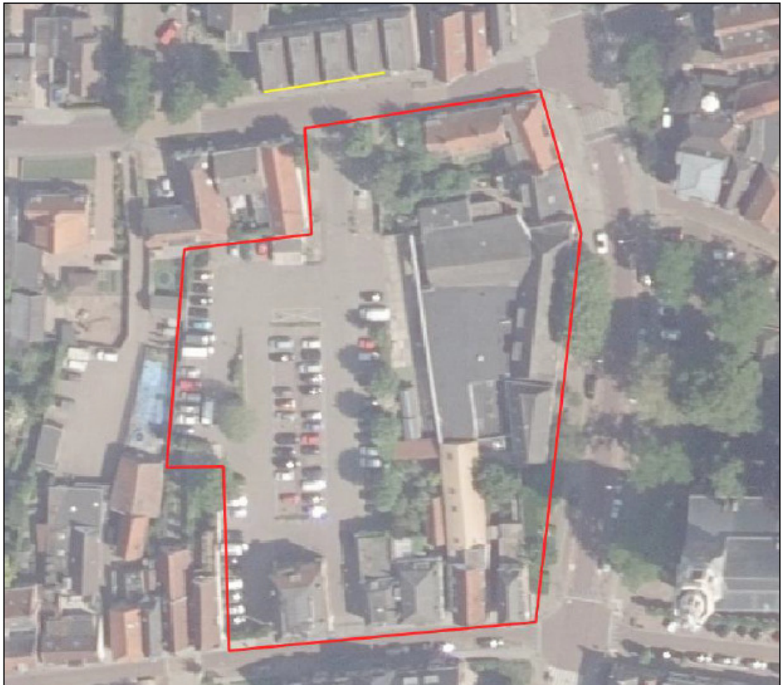
Figuur 3: Ligging tijdelijke verblijfplaatsen (gele lijn) gewone dwergvleermuis.