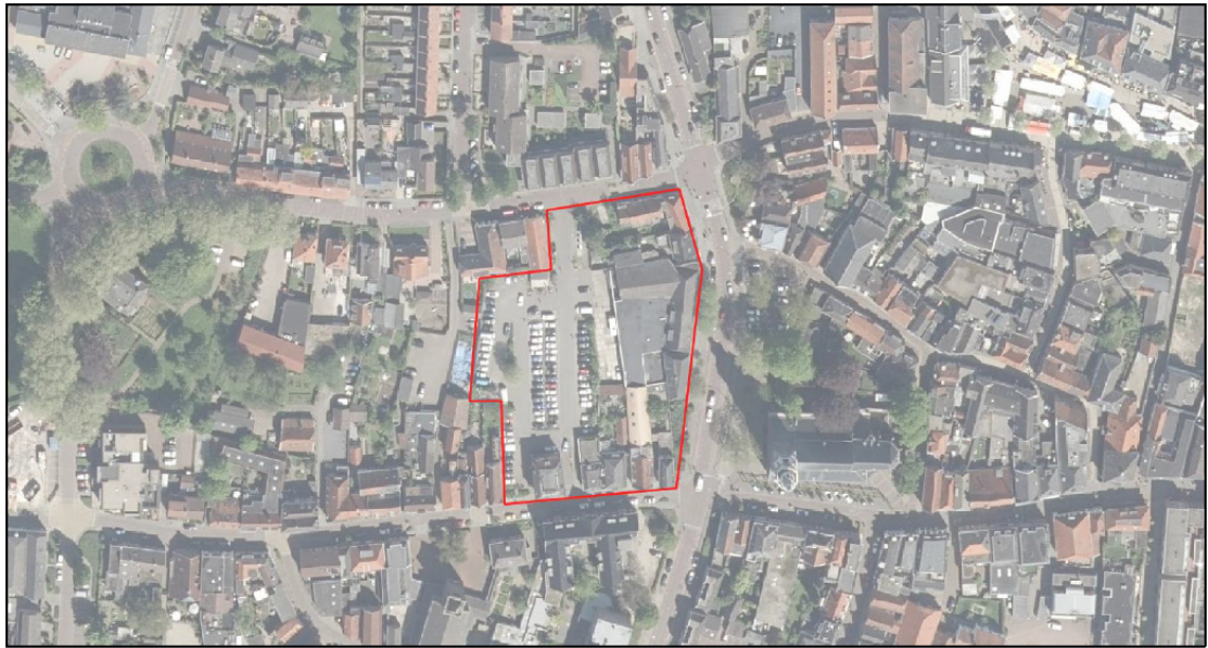
Figuur 1: Ligging plangebied Kerkplein te Nijkerk