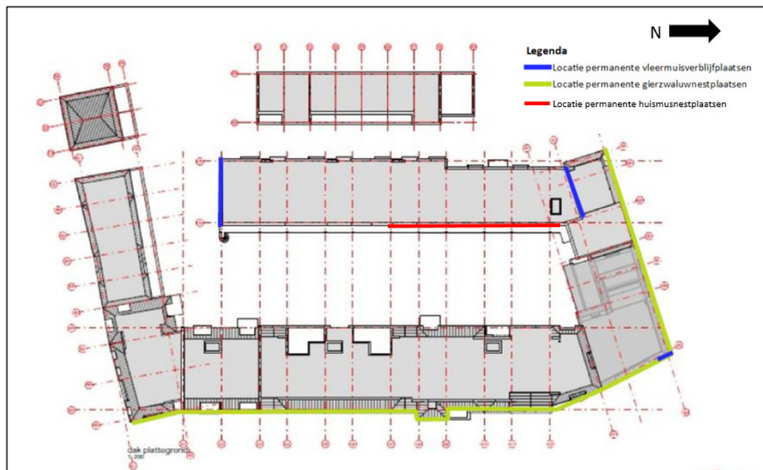
Figuren 12 en 13: Impressie gevel waar de permanente verblijfplaatsen voor huismuis gerealiseerd zullen worden en de locaties van de permanente verblijfplaatsen voor gewone dwergvleermuis, gierzwaluw en huismuis.