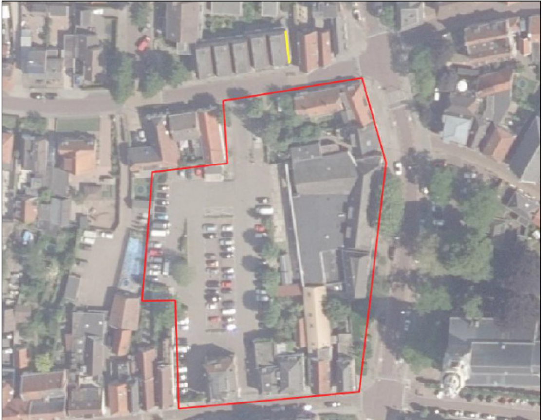
Figuur 5: Ligging tijdelijke verblijfplaatsen (gele lijn) voor huismus