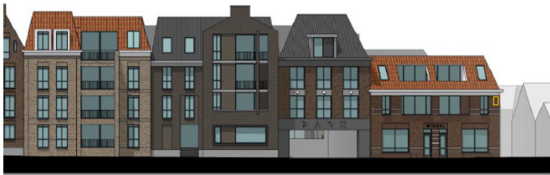
Figuren 9, 10 en 11: Ligging permanente verblijfplaatsen voor vleermuizen