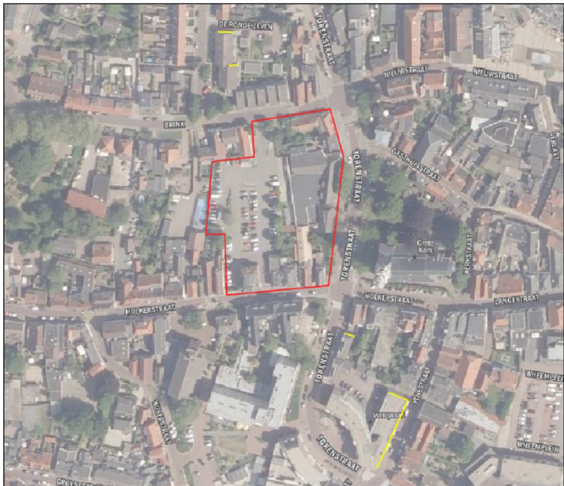
Figuur 4: Ligging tijdelijke verblijfplaatsen (gele lijnen) gierzwaluw