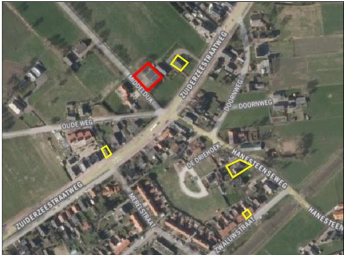
Figuur 3. Locaties tijdelijke huismuskasten (gele kaders) ten opzichte van het plangebied (rode kader). Locaties: Zuiderzeestraat 686, Zuiderzeestraat 690, Hanesteenseweg 7 en Zwaluwstraat 66. Op elke locatie zijn vier huismuskasten opgehangen van het type VivaraPro NK MU 04.