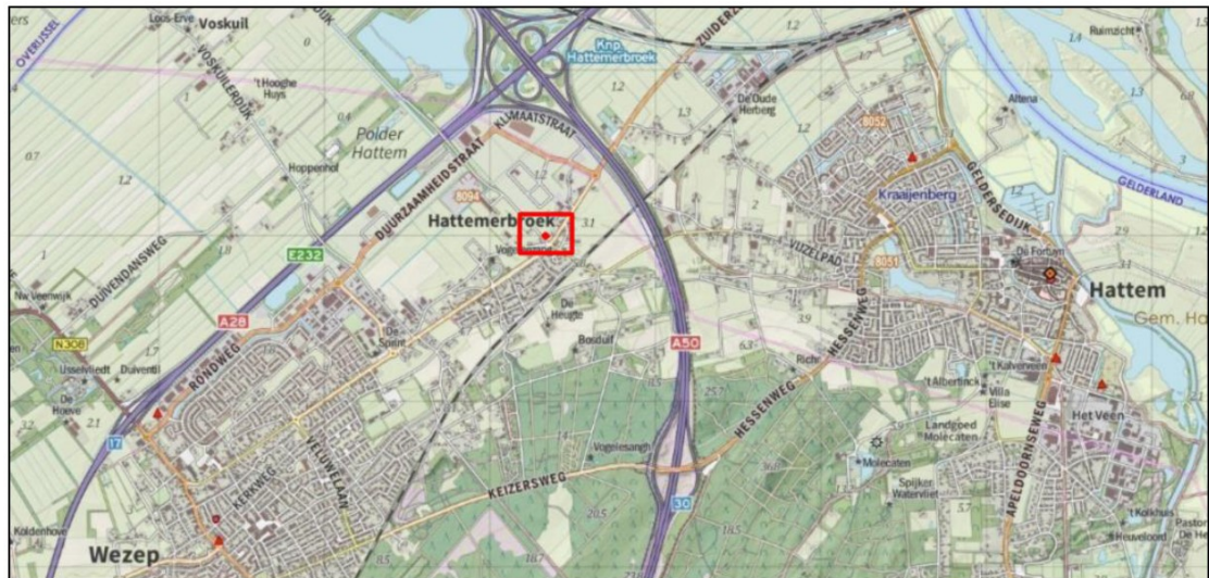
Figuur 1. Ligging plangebied Middeldijk 1 te Hattermeerbroek.