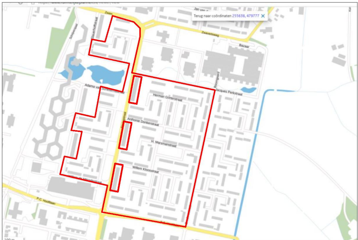
Figuur 1. Begrenzing gebied met te renoveren woningen in Hengelo (rode lijn). Niet alle woningen in het plangebied worden gerenoveerd.

In figuur 1 is het gebied met te renoveren woningen weergegeven.