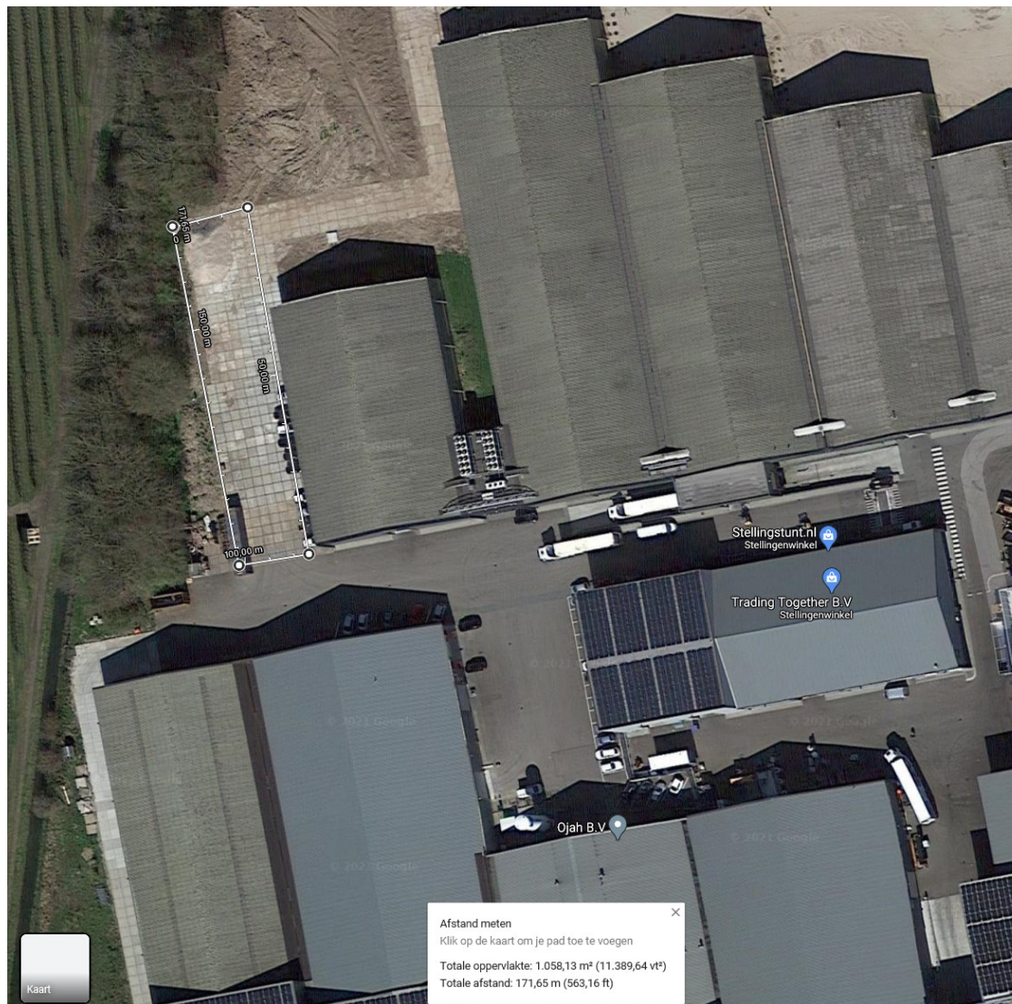
Figuur 3: Ligging compensatielocatie 1, kadastraal perceel Ochten G 461, binnen de witte lijn. Perceel is nu nog betegeld, maar wordt met het oog op de herplant, weer steenvrij gemaakt