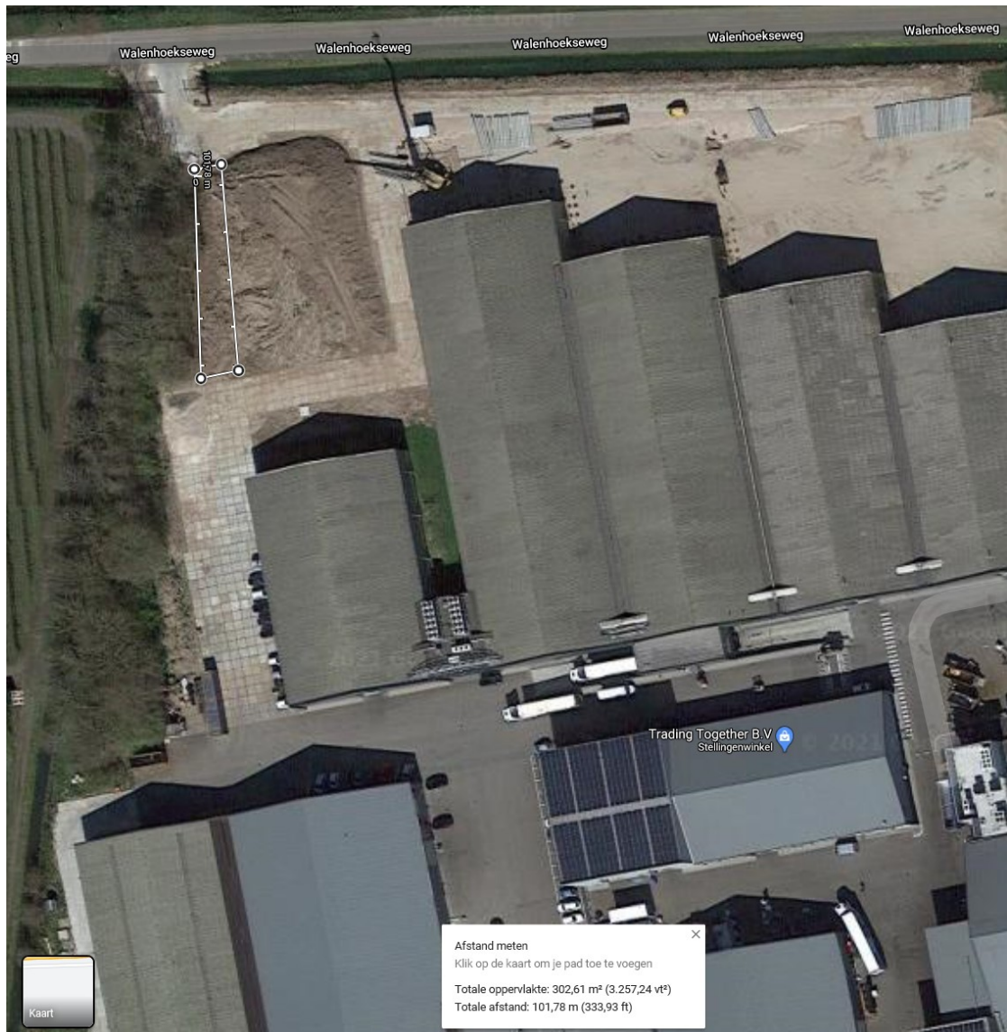
Figuur 2: Ligging extra gevelde houtopstand binnen de witte lijnen (ter hoogte van Cuneraweg 11 te Ochten, kadastraal perceel Kesteren C 1288).