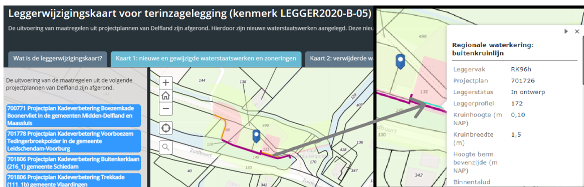
Figuur 1: Voorbeeld weergave van de interactieve leggerwijzigingskaart

Door op een waterstaatswerk op de kaart te klikken, opent er een pop-up scherm. Hierin staan de specifieke gegevens van dat waterstaatswerk, zoals de afmetingen of op wie de onderhoudsplicht rust. Ook kan, indien van toepassing, de bijlage met het leggerprofiel worden geopend. Een voorbeeld van de werking van de leggerwijzigingskaart is weergegeven in Figuur 1.