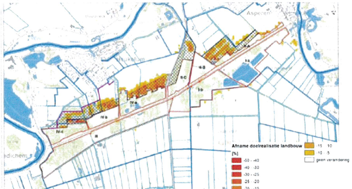
Figuur 2: Berekende afname doelrealisatie landbouw (natschade) als gevolg van hogere peilen in de bufferzone (Toelichting op het peilbesluit Tielerswaard, Witteveen + Bos 2019)

randeffecten van de peilopzetting. Hier gaat in een strook van ca 50 m de GHG (gemiddeld hoogste grondwaterstanden) 5 tot 10 cm omhoog (figuur 3). De natschade bedraagt hierdoor zo'n 5 tot 10 %.