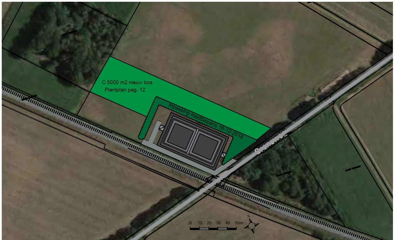
Figuur 2: Ligging compensatielocatie nabij de kruising van de Grensweg en de spoorlijn in de gemeente Berkelland, kadastraal perceel Gemeente Eibergen sectie X nummer 214.