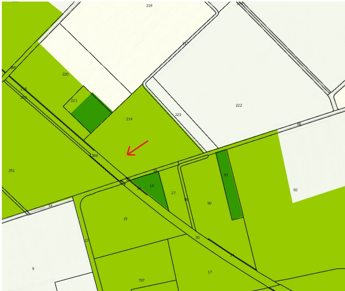
Figuur 4: Ligging compensatielocatie houtopstand ten opzichte van GO (lichtgroen) en GNN (donkergroen).