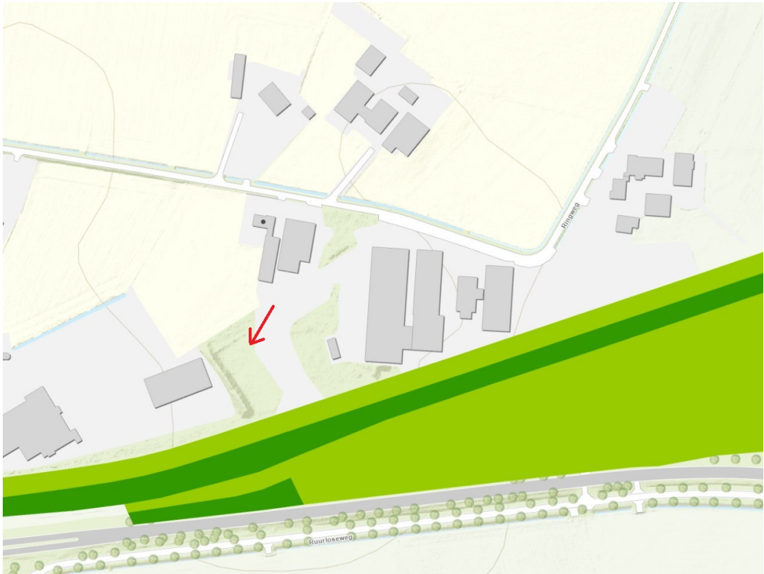
Figuur 3: Ligging gevelde houtopstand ten opzichte van GO (lichtgroen) en GNN (donkergroen).