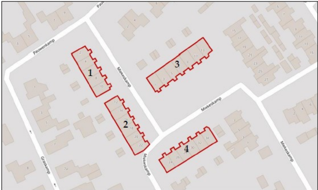
Figuur 1. Ligging en begrenzing projectlocatie Miekeskamp 1-13 (oneven) en 2-34 (even).