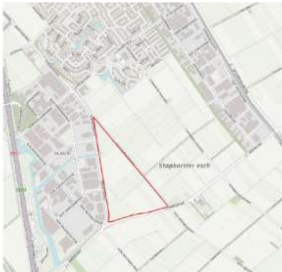
Figuur 1 - Projectgebied

Het bouwrijp maken van de locatie staat gepland vanaf medio 2021. Deze fase duurt circa vier maanden. Elk perceel wordt door individuele ontwikkelaars bebouwd. Daardoor is nog niet met zekerheid vast te stellen hoe lang het duurt voordat percelen worden verkocht en het gehele bedrijventerrein gereed is. De verwachting is dat het meerdere jaren duurt. Een ontheffing wordt daarom aangevraagd voor de periode van 1 juni 2021 t/m 31 mei 2028.