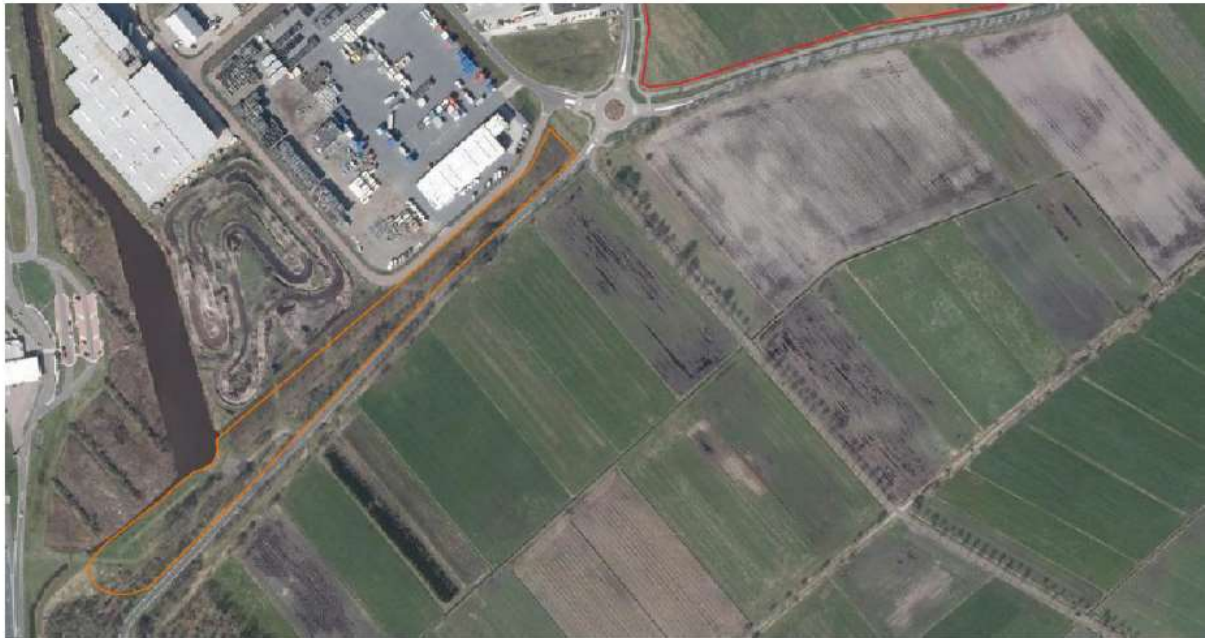
De ligging van het plangebied (rood omlijnd in het noordoosten) ten opzichte van nieuw ingericht leefgebied, ook geschikt voor de wezel (oranje omlijnd) en overige landschapselementen.