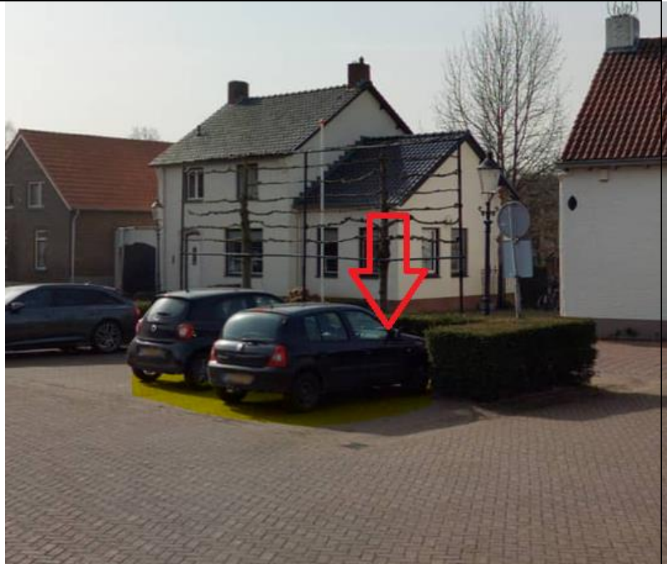
Foto 2 locatievoorstel