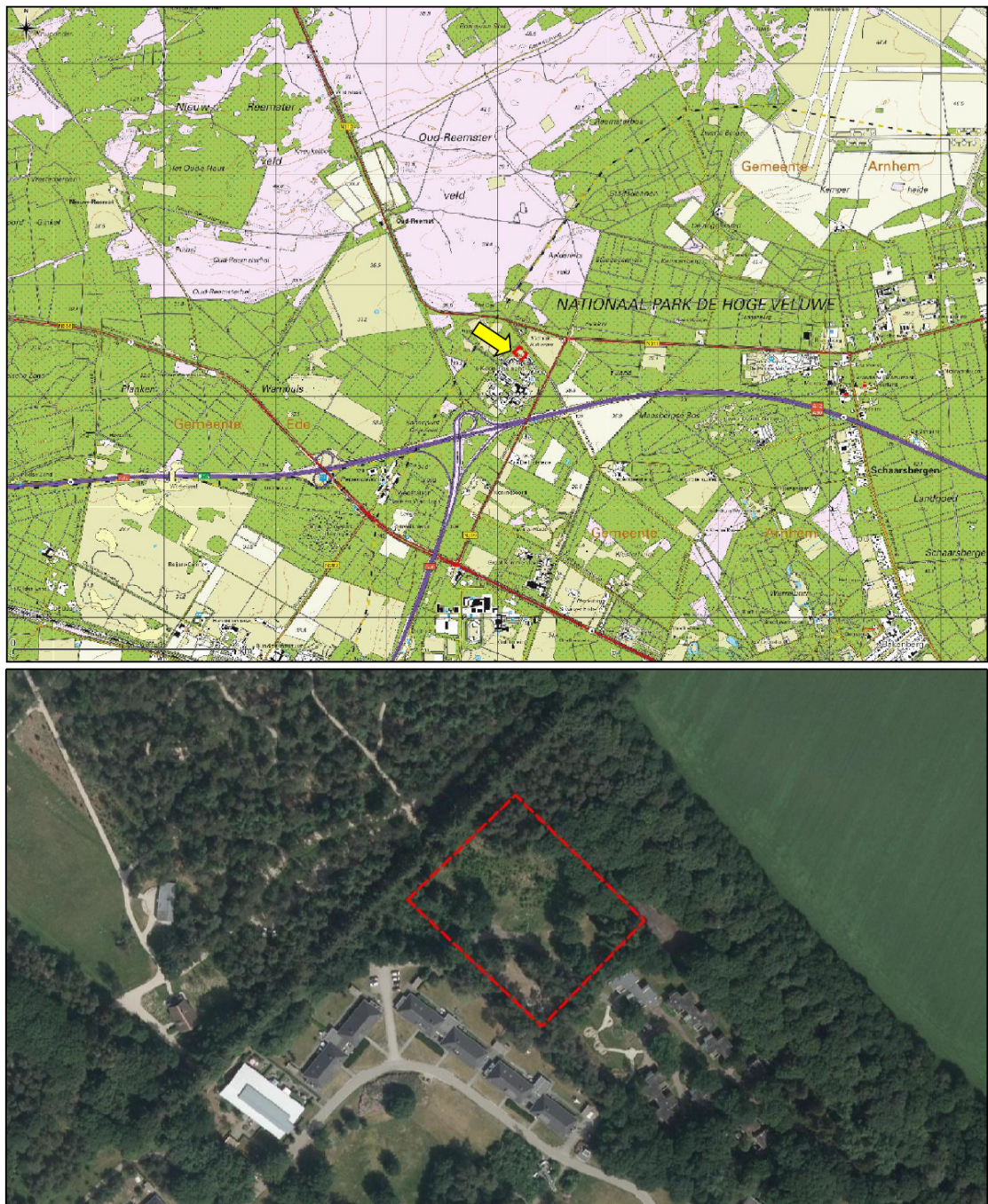
Figuur 1. Ligging (boven) en begrenzing (onder) plangebied Schoppenkoning 18 te Arnhem