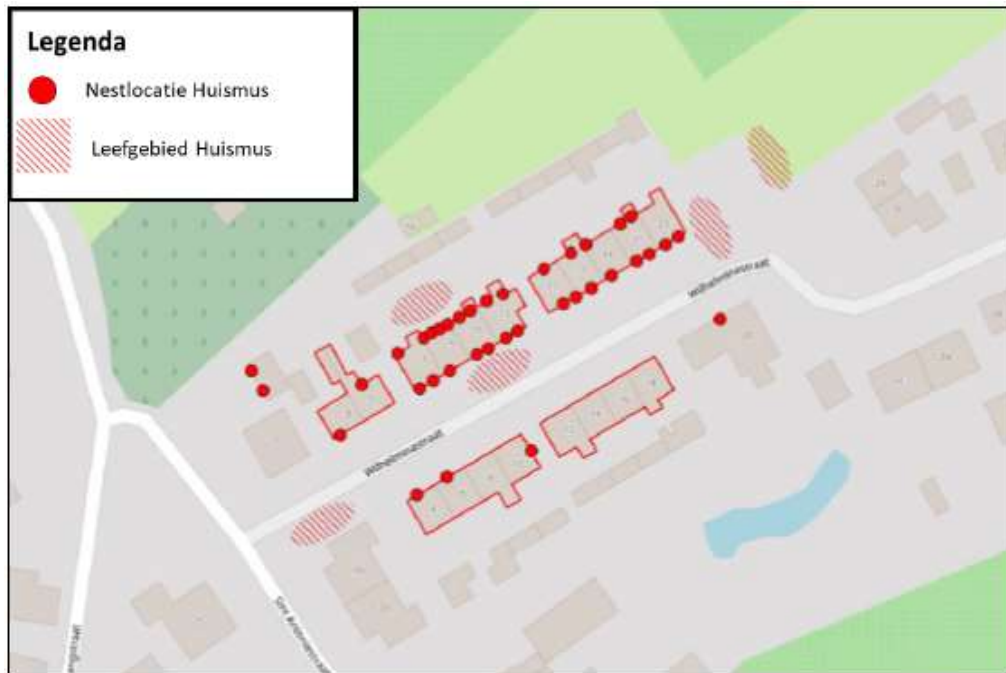
Figuur 2: nestlocaties huisemus