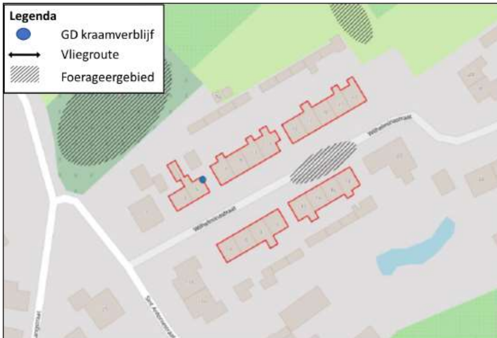
Figuur 3: kraamverblijf gewone dwergvleermuis