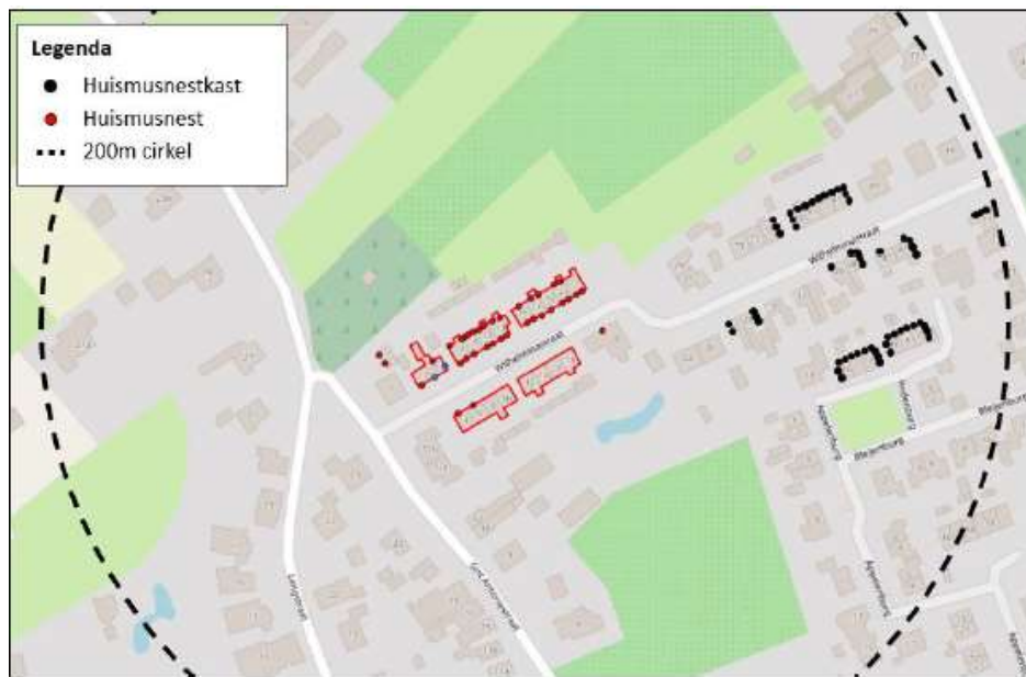
Figuur 4: Ligging tijdelijke mitigatie huismus