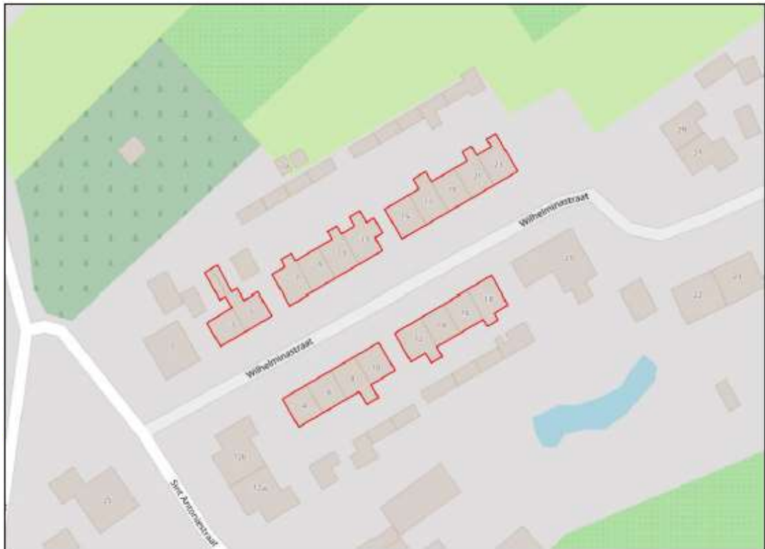
Figuur 1: Ligging plangebied Wilhelminastraat 3-23 (oneven) en 4-18 (even) te Tuil