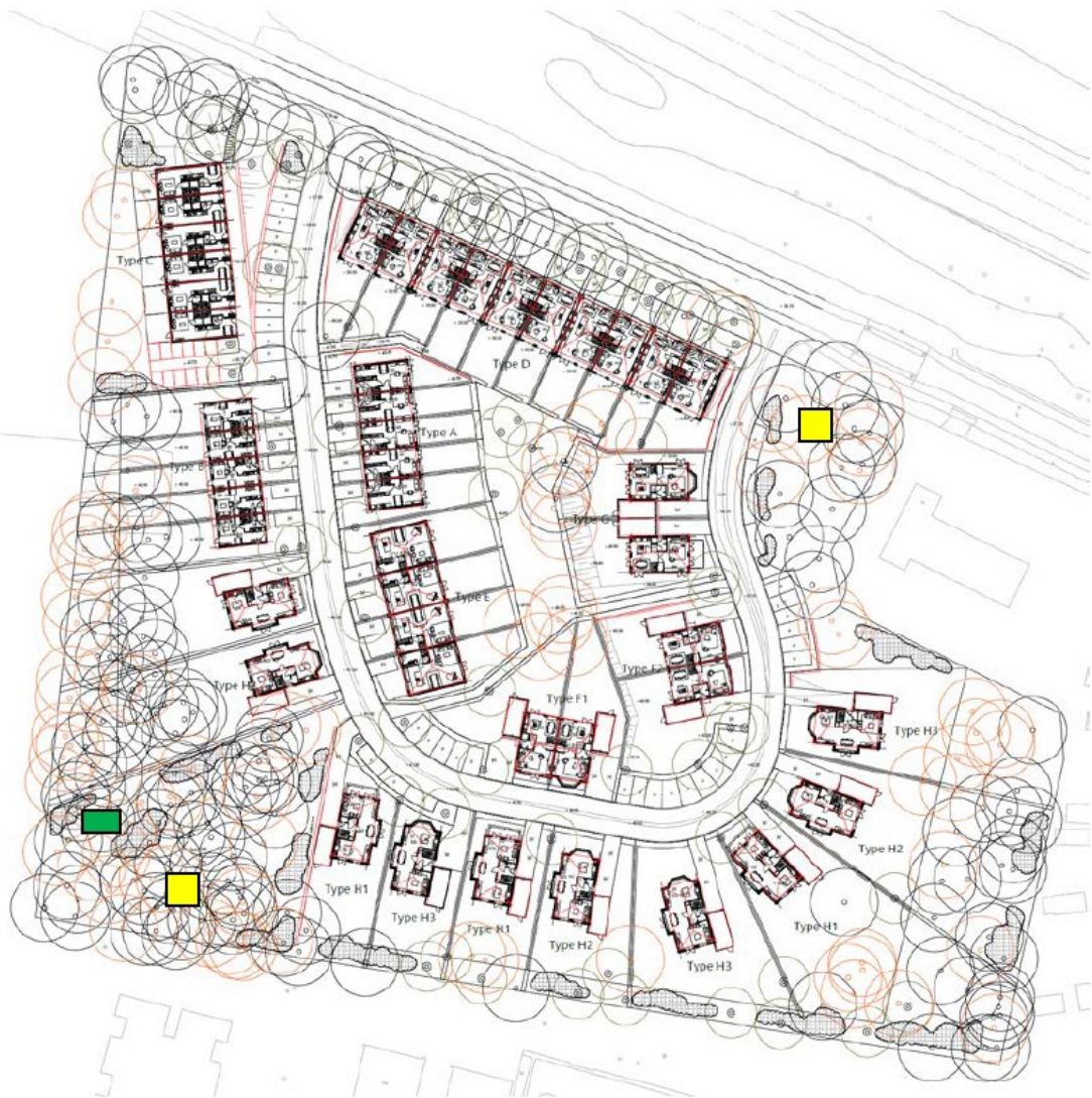
Figuur 3. Beoogde ontwikkeling binnen het plangebied en de locaties waar de alternatieve voorzieningen voor eekhoorn (gele vlak) en steenmarter (groene vlak) zijn aangebracht.