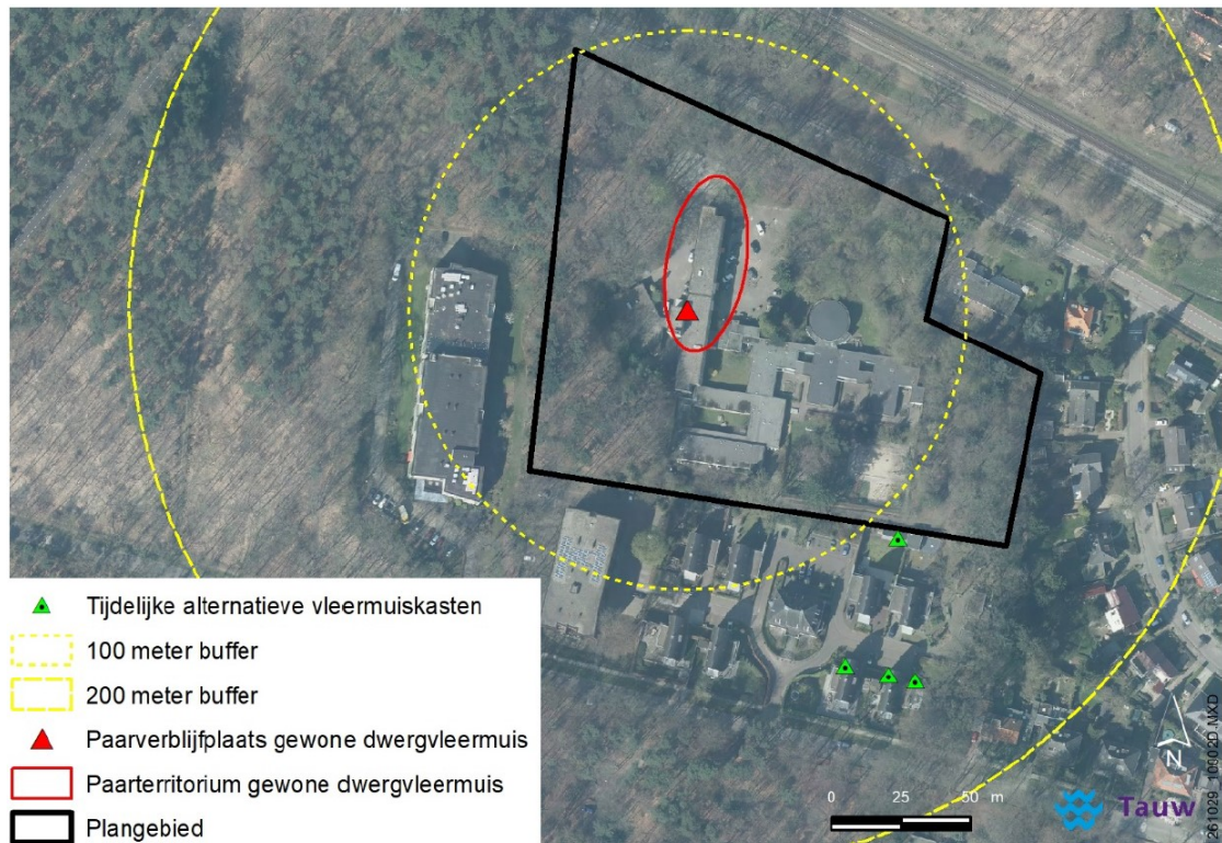
Figuur 2. Locaties opgehangen tijdelijke voorzieningen gewone dwergvleermuis (vleermuiskasten type VK WS 01 van VivaraPro) ten opzichte van het plangebied en de huidige verblijfplaats.