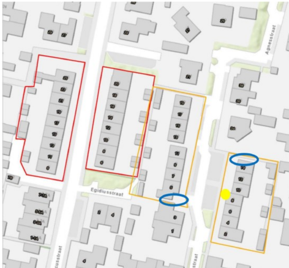
Figuur 1 Plangebied complex 103 (oranje lijn) Agnesstraat Alverna (rode lijn is complex 102, hoort niet bij plangebied). Blauwe cirkels locatie paarterritoria gewone dwergvleermuis. Gele stip huismusnest.