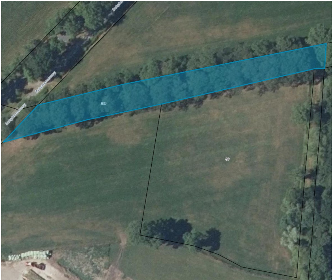
Figuur 2: Ligging gevelde houtopstand (ter hoogte van Rossweg 2-6, Perceel AA, 169).