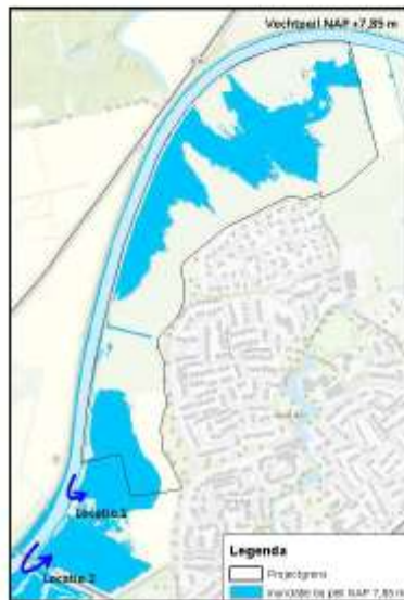
Figuur: Maatgevende locaties en inundatie bij een peil van NAP +7,65m

plangebied (tussen plangebied en de J.C. Kellerlaan) blijft de zandwerende kade intact. Maatgevend voor inundaties zijn de laagste delen van deze te handhaven zandwerende kade: deze zijn ingemeten op +7,65 m NAP en zijn weergegeven in onderstaande figuur als locatie 1 en locatie 2.