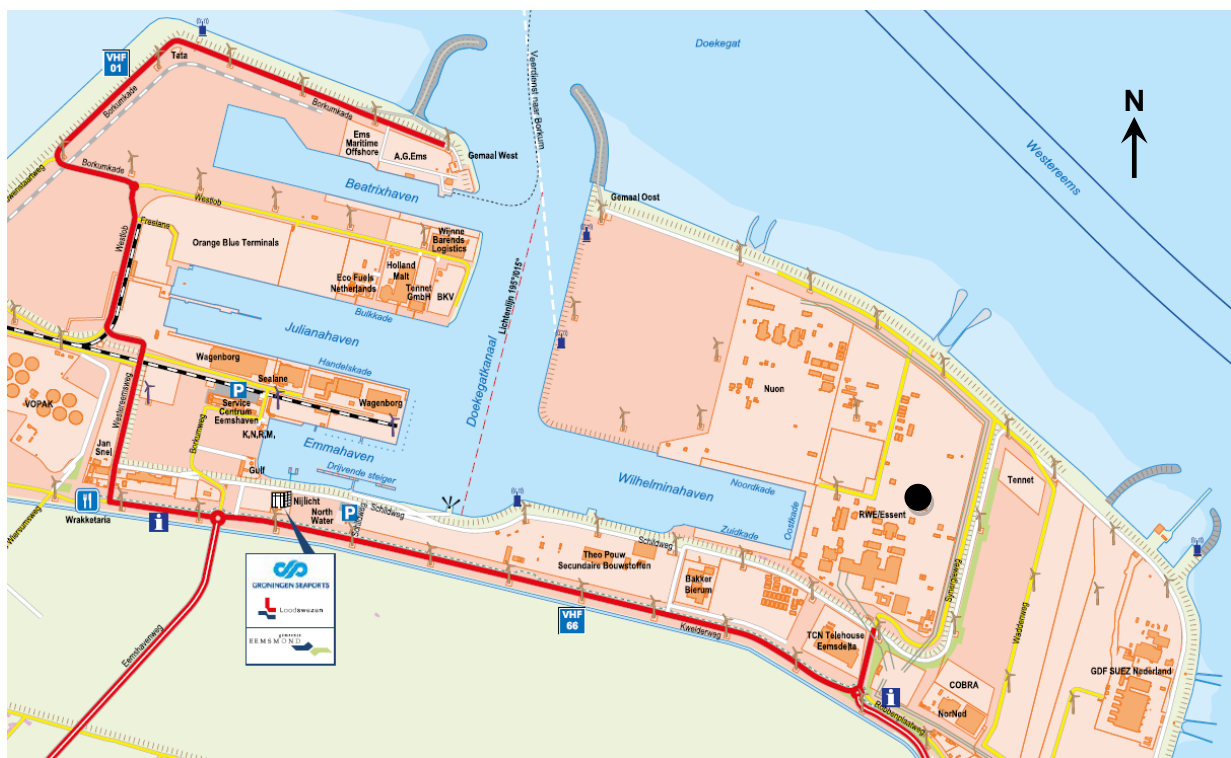
Figuur 2 Locatieschets van de Centrale in de Eemshaven (zie cirkel)

De ligging van de Centrale is weergegeven in figuur 2.