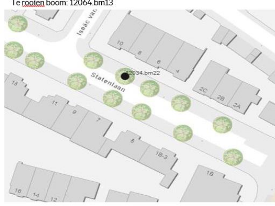
Te rooien boom: 12034.bm22