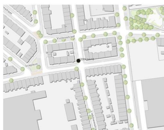
Te rooien boom: 12064.bm13