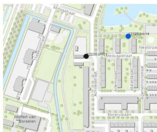
Te rooien boom: 12200.21