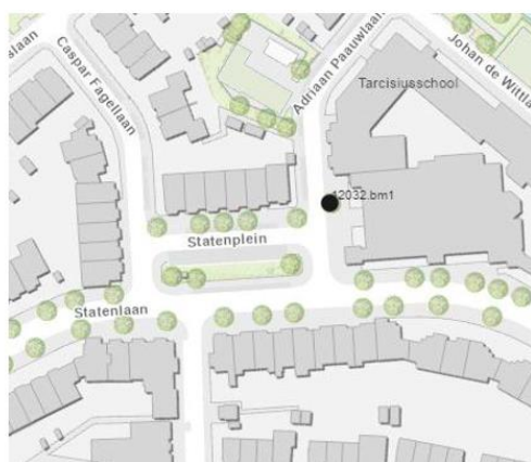
Te rooien boom: 12032.bm1

-er wordt u een herplantplicht opgelegd voor 8 bomen met een minimaal te bereiken kroon diameter van 8 - 12 meter (1e grootte), op basis van artikel 4:11f van de APV van Rotterdam. De stamomtrek van de bomen dient bij aanplant een minimale maat te hebben van 16/18 cm. De herplant moet worden uitgevoerd in het eerstvolgende plantseizoen na kap.