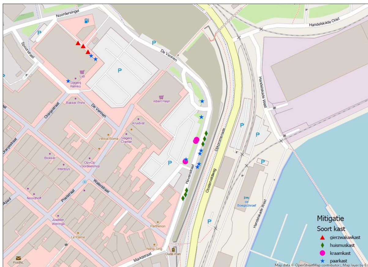
Figuur 2. Geplaatste kasten.

In april 2020 zijn negen tijdelijke gierzwaluwkasten (3x type drievoudige kast) en twaalf tijdelijke huismusnestplaatsen (in de vorm van drie huismustillen, met elk vier nestkasten) geplaatst op de parkeerplaats en in de groenstrook ten oosten van het plangebied. Voor de locaties van de kasten zie figuur 2. Bij de plaatsbepaling en het ophangen van de kasten is een ecologisch deskundige op het gebied van huismus en gierzwaluw betrokken geweest. Bij het ophangen van de kasten is onder meer rekening gehouden met minimale hoogte van 3 m, een vrije aanvliegroute en een ligging die niet te heet of te koud is.