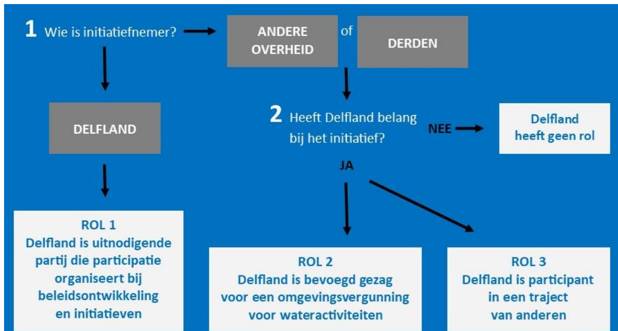
Figuur 2: Stroomschema om de participatie-rol van Delfland te bepalen