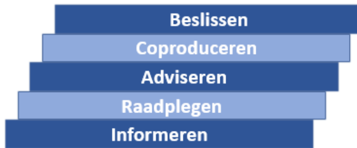
Figuur 4: Participatieladder voor bepalen participatieniveau (voor uitleg van de begrippen, zie bijlage 1)

De beïnvloedingsruimte moet passen bij de ruimte die er is voor inbreng van belanghebbenden. Bij het voorbereiden van een peilbesluit raadpleegt Delfland belanghebbenden, want de afweging van het waterpeil is een taak van het waterschap, die Delfland niet bij bewoners kan neerleggen. Ook de waterveiligheid staat niet ter discussie als er waterkeringen verhoogd of verbreed moeten worden, maar bij de inpassing van de aangepaste kering in de fysieke leefomgeving kunnen inwoners adviseren of samen met Delfland coproduceren.