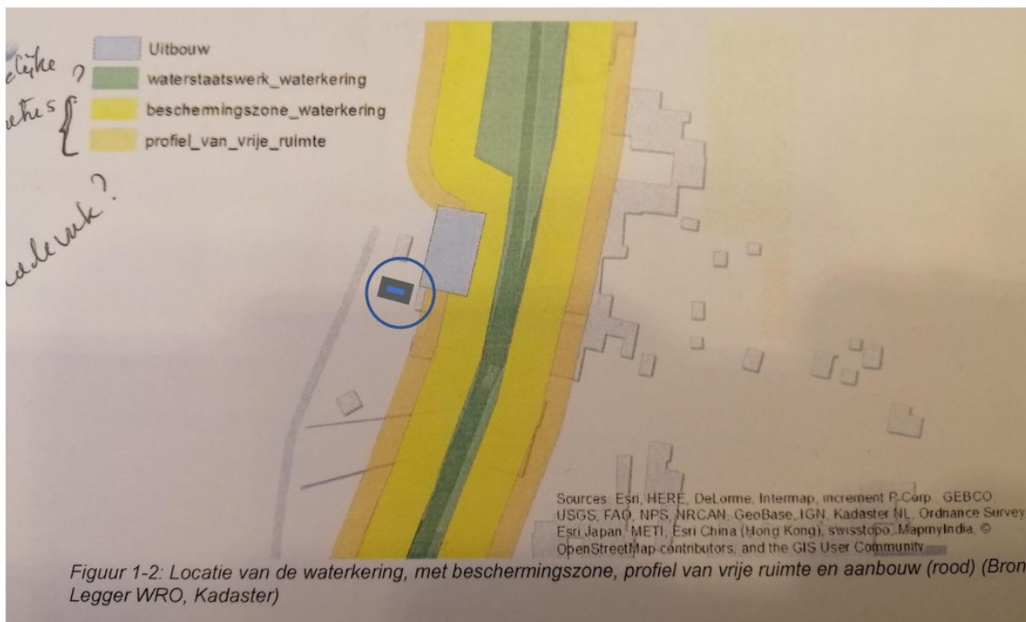
Figuur 1-2: Locatie van de waterkering, met beschermingszone, profiel van vrije ruimte en aanbouw (rood)