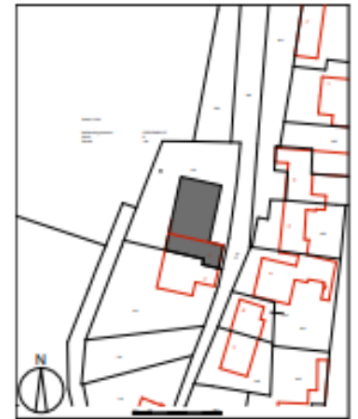
Situatie Schaal 1/1000

De tuin is met vergunning van het Ministerie van verkeer en Waterstaat DLB 97/3095 van 26/2/1997 opgehoogd tot 33,30 NAP. De aanleg van het zwembad heeft geen gevolgen voor bergingscapaciteit.