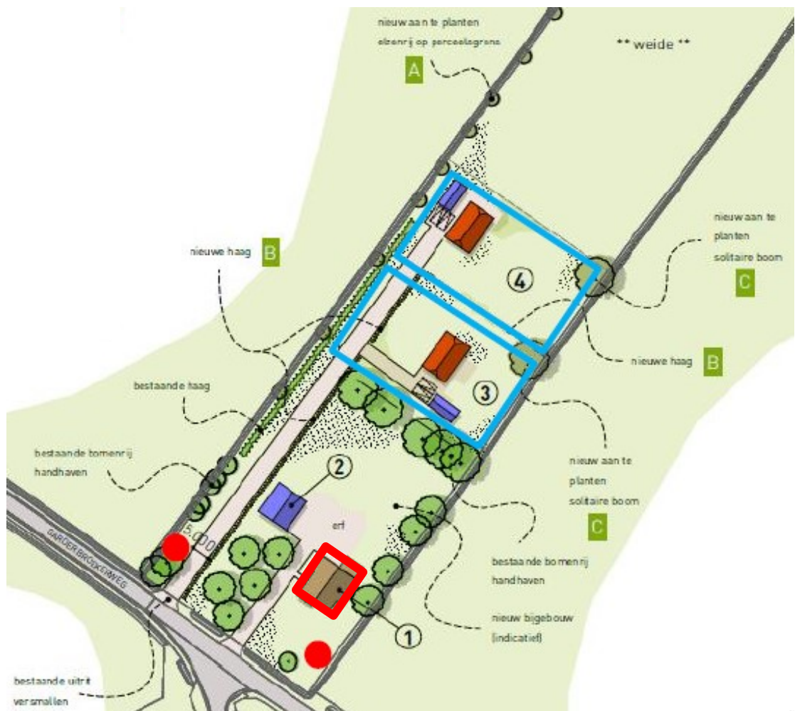
Figuur 2 Beoogde situatie van het plangebied met bouwkavels (nummer 3 en 4) en aan te planten groen. De te realiseren alternatieve voorzieningen voor de huismus; huismustillen (rode stippen), gevelpannen (rood omkaderd) en 20 inbouwkasten (blauw omkaderd). Ook worden op initiatief van de aanvrager vier vleermuisvoorzieningen gerealiseerd bij nummer 2.