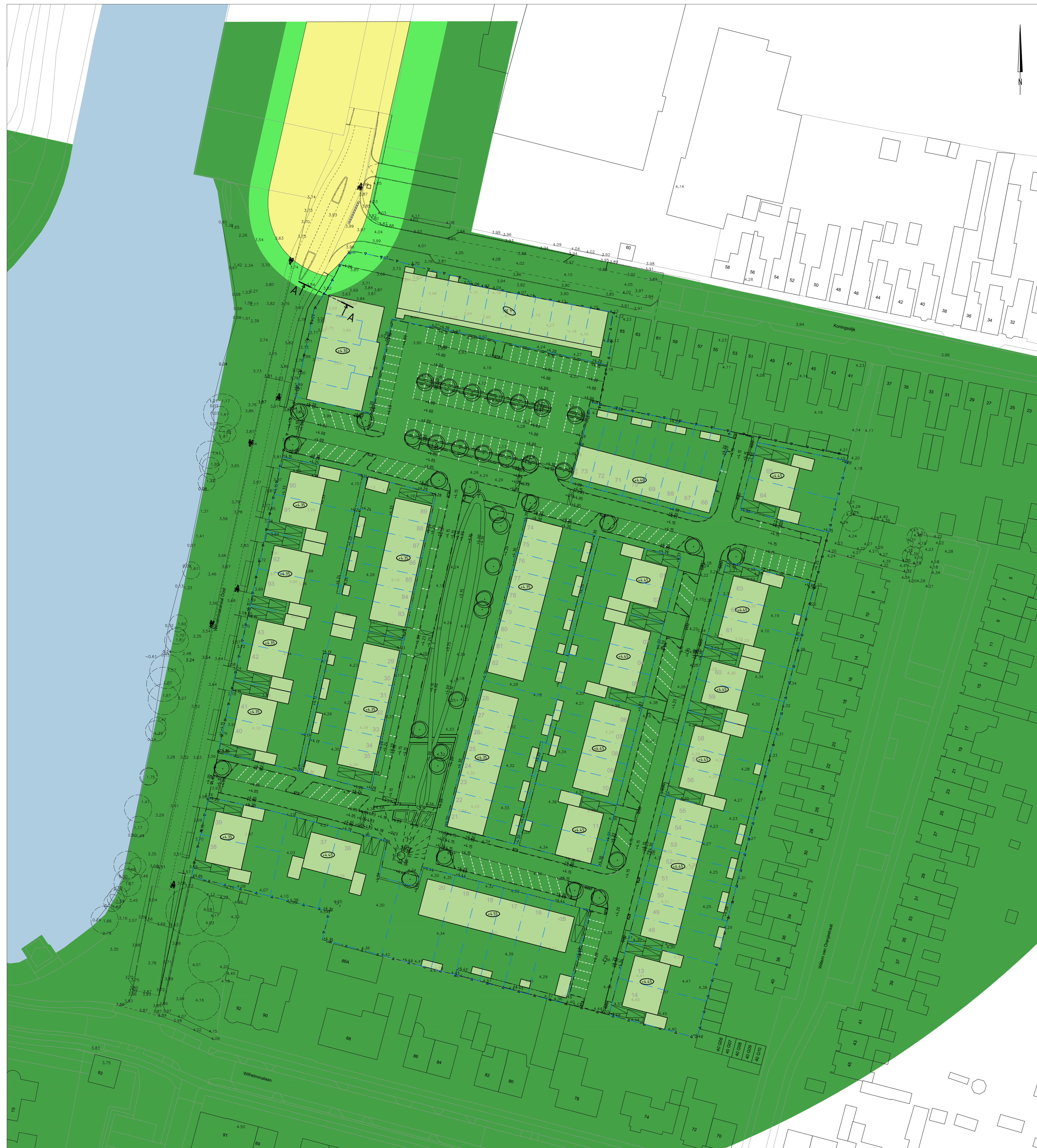
Gehele plangebied Schaal 1:500