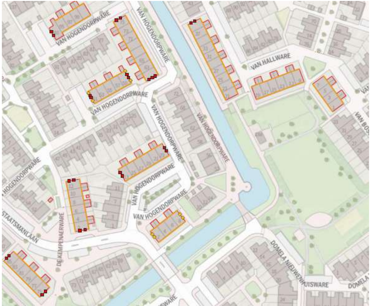
Figuur 4: Permanente voorzieningen, namelijk 25 inbouwkasten voor gierwaluw (rood vierkant), 8 inbouwkasten voor gewone dwergvleermuis (gele ruit) en 720 meter vogelschroot op de derde pannenrij voor de huismus (oranje lijnen).