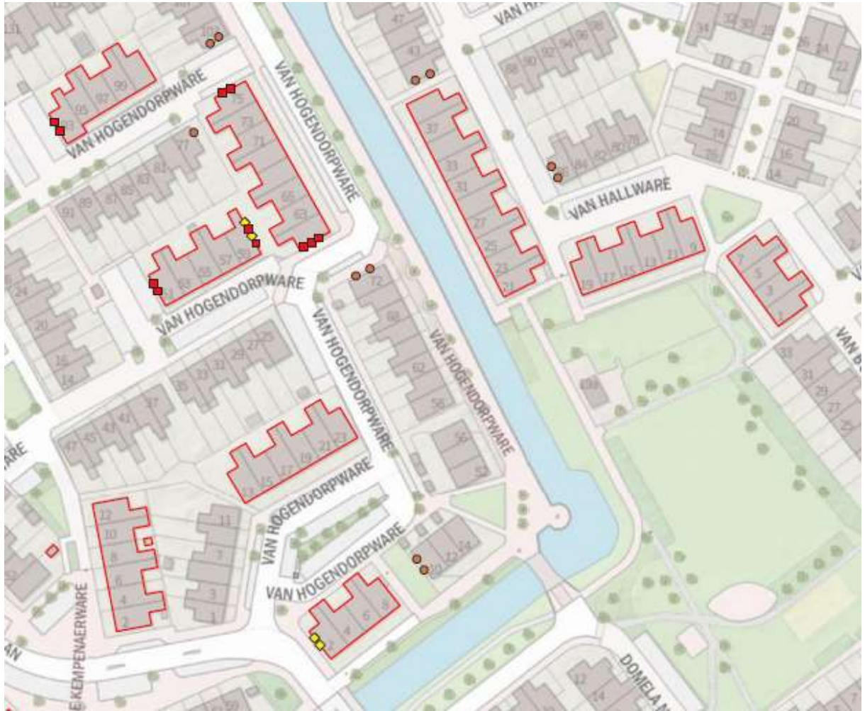
Figuur 3: Tijdelijke voorzieningen, namelijk 11 inbouwkasten voor gierzwaluw (rood vierkant), 4 inbouwkasten voor gewone dwergvleermuis (gele ruit), 11 nestkasten voor de huismus (roze cirkel)