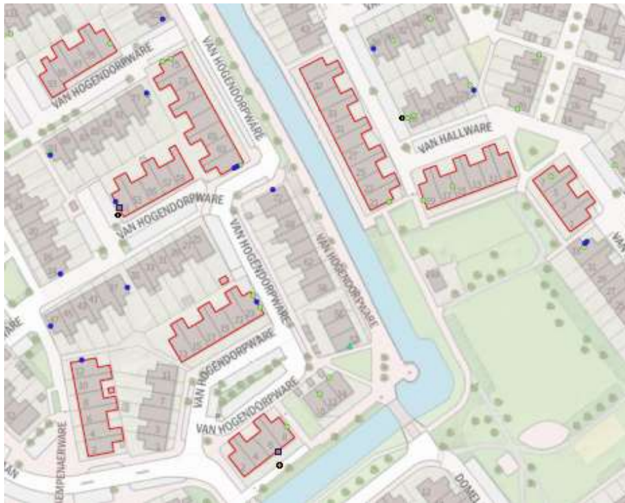
Figuur 2: Plangebied (rood omlind) met aangetroffen ecologische functies, namelijk zomer- en paarverblijfplaats van de gewone dwergvleermuis (lila vierkant), nest van gierzwaluw (blauwe cirkel) en nest van huismus (groene cirkel)