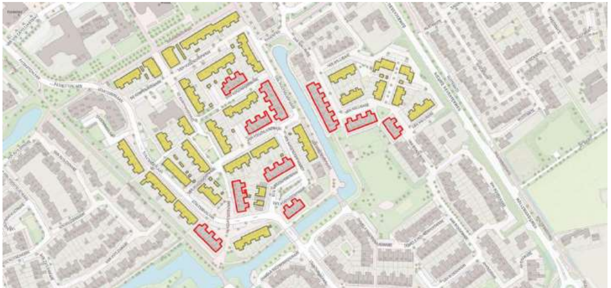
Figuur 1: Plangebied van Hogendorpware e.o. te Zwolle (rood omlijnd)

SWZ Woningcorporatie is van plan de 60 woningen in het plangebied te renoveren en daarbij de daken beter te isoleren. De werkzaamheden duren drie weken per woonblok. In de aangevraagde planning worden de woningen voor het broedseizoen van 2021 ongeschikt gemaakt voor alle aangevraagde soorten, waarna tijdens het voorjaar en zomer alle werkzaamheden zouden plaatsvinden. In augustus 2021 zouden dan de laatste werkzaamheden worden afgerond. Deze planning is echter niet te verenigen met de winterrustperiode van de gewone dwergvleermuis, waarvan verblijfplaatsen zijn aangetroffen in het plangebied. Naar aanleiding van bovenstaande voorschriften zal de planning anders vorm gegeven moeten worden. 16