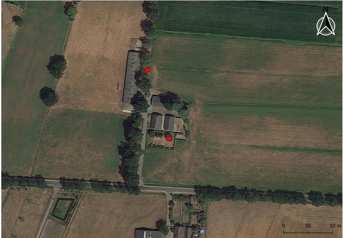
Figuur 2: Ligging van de locaties van de aangebrachte nestkasten.