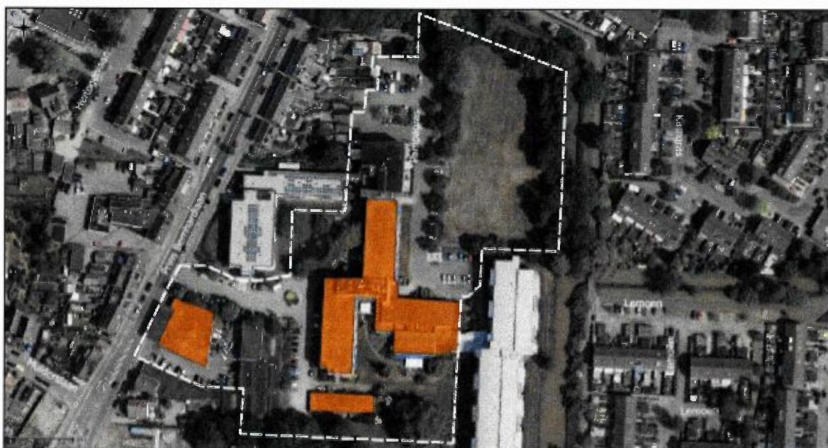
Figuur 2. Luchtfoto (2016) van het plangebied en de onderzochte bebouwing (oranje).