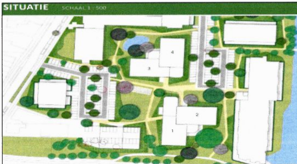
Figuur 27. Nieuwbouw situatie 't Boveneind.