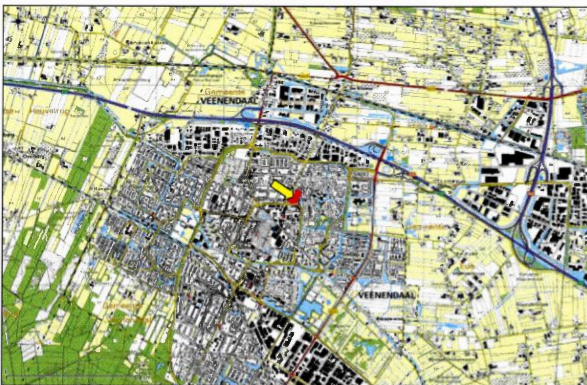
Figuur 1. Topografische kaart van het plangebied en de onderzochte bebouwing (rood).