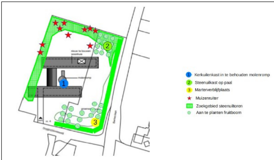
Figuur 3: Kaart mitigerende maatregelen binnen projectlocatie