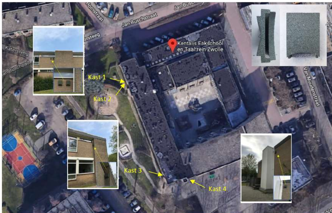
Figuur 9 De globale positie van de vier geplaatste vleermuiskasten aan het gebouw van de Kentalis Enkschool. Linksonder op de grote foto is nog net de noordoosthoek van de hoogbouw van de Stiloal zichtbaar. Rechtsboven (kleine foto's) laten zien welke kasten hier zijn geplaatst. Dit zijn duurzame vleermuiskasten geproduceerd uit houtbeton.