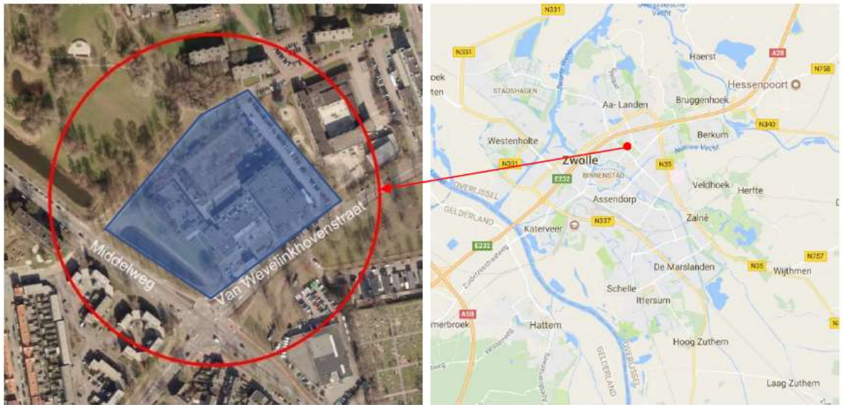
Figuur 1 Ligging van het plangebied (blauw gearceerd) aan de Van Wevelinkhovenstraat 103 - 107 te Zwolle (links) en de globale ligging van het onderzoeksterrein in de gemeente Zwolle (rechts).