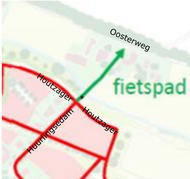
Uitsnede uit afbeelding van bestemmingsplan "Huurlingsedam fase 2". .