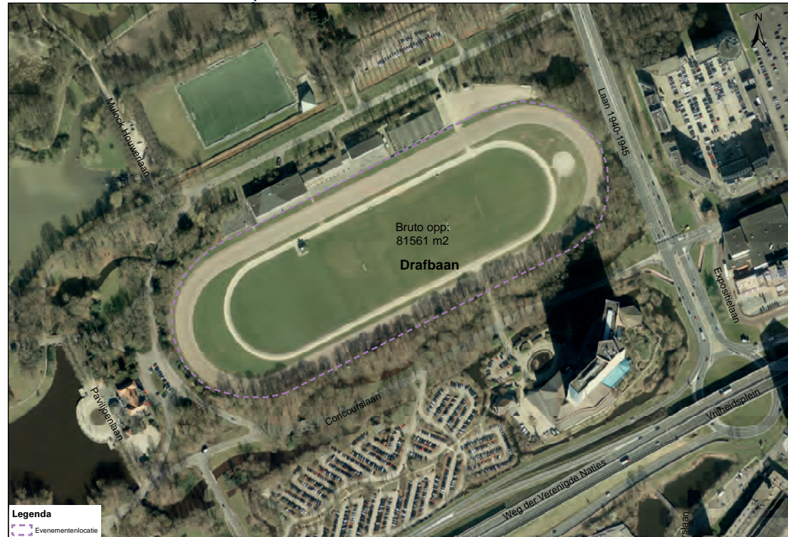
Luchtfoto evenementenlocatie Stadspark Drafbaan

De oppervlakte van de evenementenlocatie drafbaan Stadspark is circa 81.600 m 2 . De werkelijk inzetbare ruimte verschilt per evenement en is onder andere afhankelijk van de gebruikte opstelling op het terrein en het type evenement.