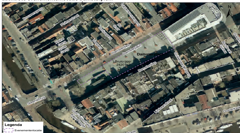
Luchtfoto evenementenlocatie Damsterplein

De oppervlakte van de evenementenlocatie Damsterplein is circa 2420 m 2 bruto. De inzetbare ruimte verschilt per evenement en is onder andere afhankelijk van de gebruikte opstelling op het terrein, het type evenement en de noodzakelijke gezondheids- en veiligheidsmaatregelen.