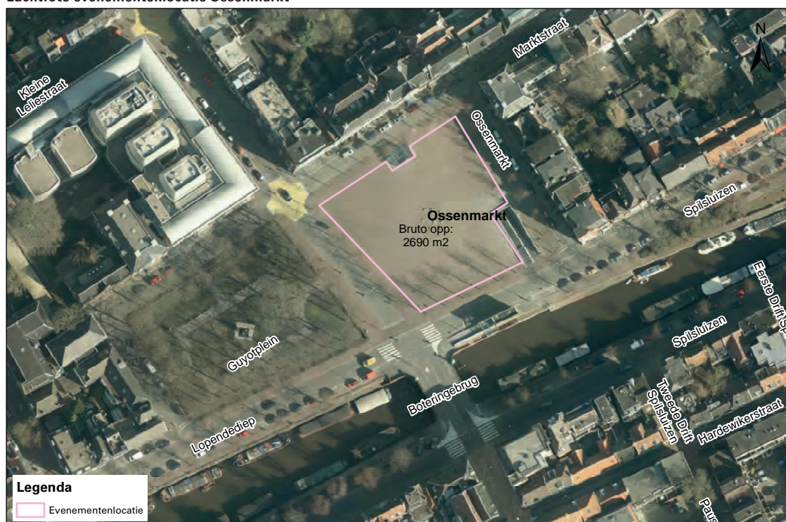
Luchtfoto evenementenlocatie Ossenmarkt

Met de Ossenmarkt beschikken wij over circa 2700 m 2 aan bruto evenementenlocatie net buiten het centrum aan de gracht. De inzetbare ruimte verschilt per evenement en is onder andere afhankelijk van de gebruikte opstelling op het terrein, het type evenement en de noodzakelijke gezondheids- en veiligheidsmaatregelen.