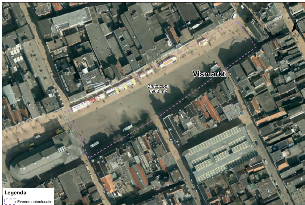
Luchtfoto evenementenlocatie Vismarkt

Met de Vismarkt beschikken wij over circa 7000 m 2 bruto aan evenementenlocatie in het hart van de stad. De werkelijk inzetbare ruimte verschilt per evenement en is onder andere afhankelijk van de gebruikte opstelling op het terrein, het type evenement en de noodzakelijk geachte gezondheids- en veiligheidsmaatregelen.