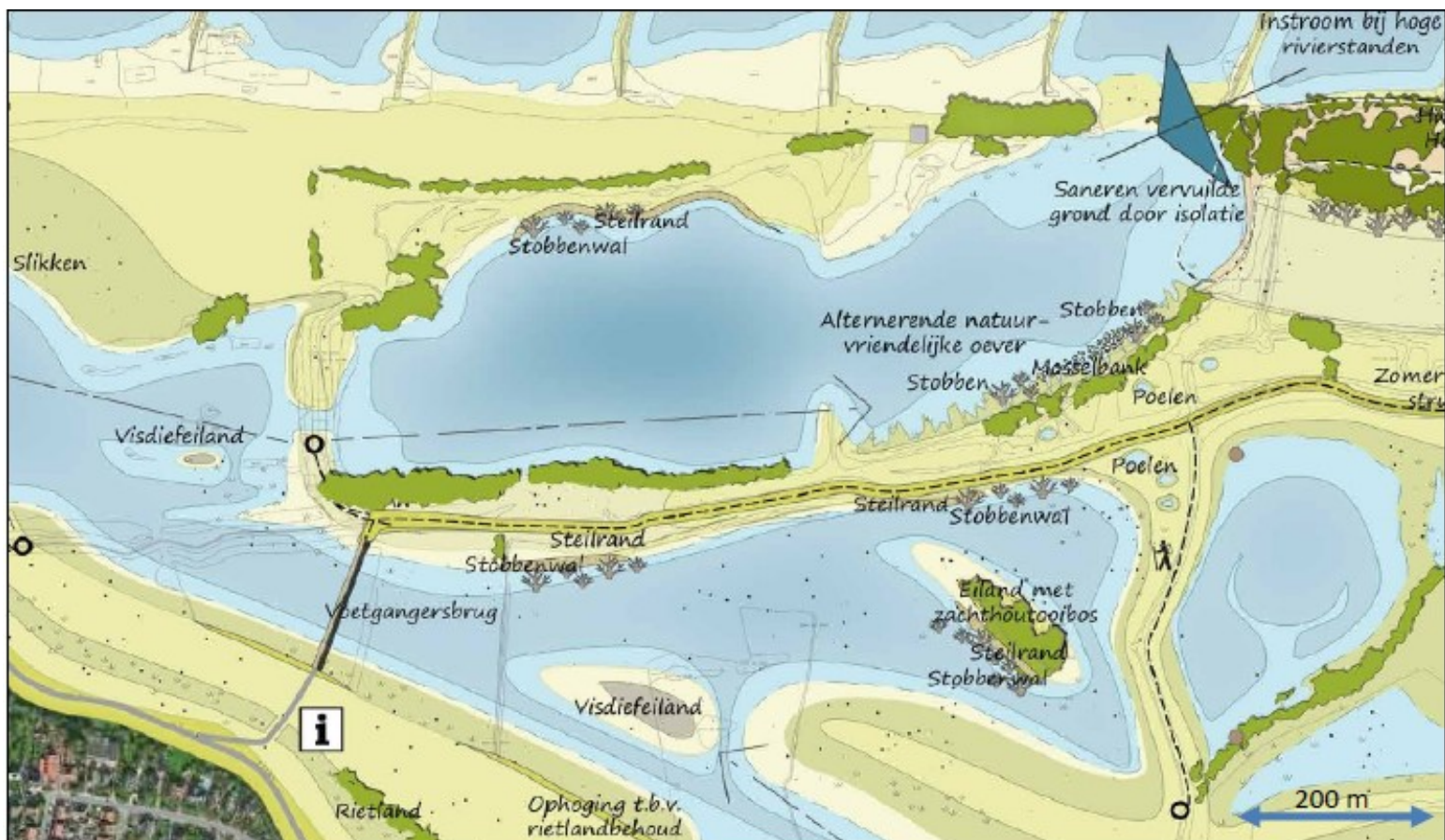
Figuur 2. Aangepaste herinrichting ADW 2.0 Aangepaste herinrichting ADW 2.0.