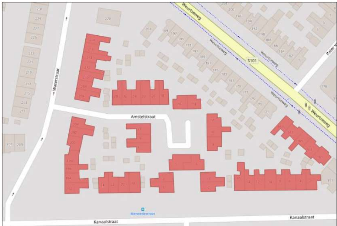
Figuur 1: Plangebied Waterkwartier