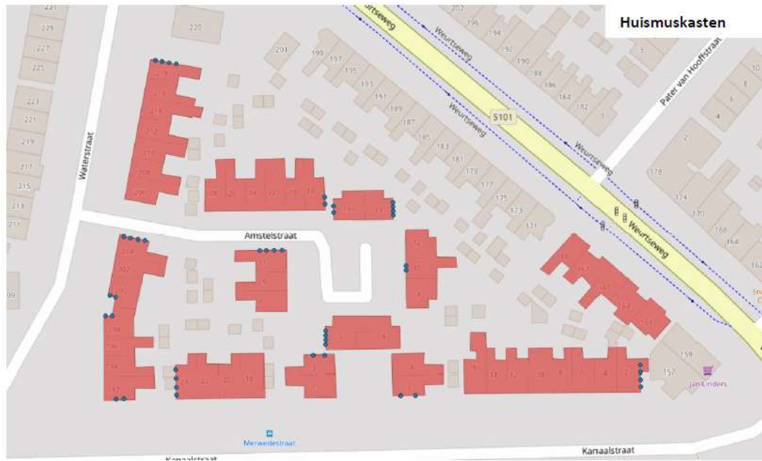
Figuur 3: Tijdelijke mitigatie huismus