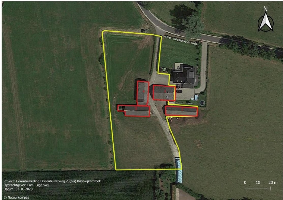
Figuur 2. Begrenzing van het plangebied Drieënhuizerweg 23bis te Kootwijkerbroek (gele kader). De oude boerderijwoning (nr 1), de aanbouw aan de westelijk stal (nr. 3) en de kapschuur (nr. 4) worden gesloopt. De overige bebouwing oostelijke stal (nr. 2), westelijke stal (nr. 3) en de nieuwbouwwoning blijven behouden in de huidige staat.