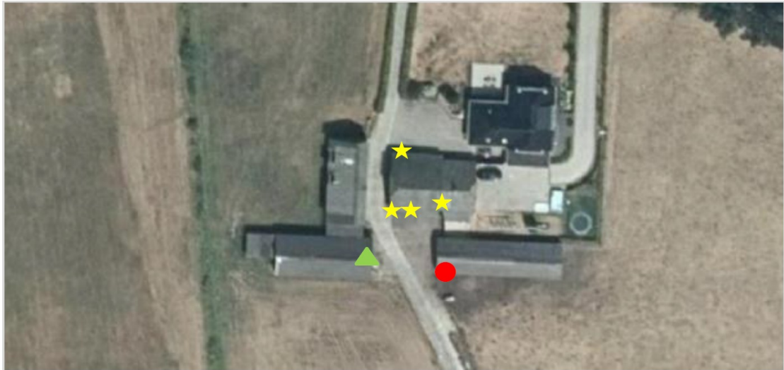
Figuur 4. Locaties nesten huismus (gele ster), steenuil (rode stip) en rustplaats steenuil (groene driehoek) in het plangebied aan de Drieënhuizerweg 23bis te Kootwijkerbroek.