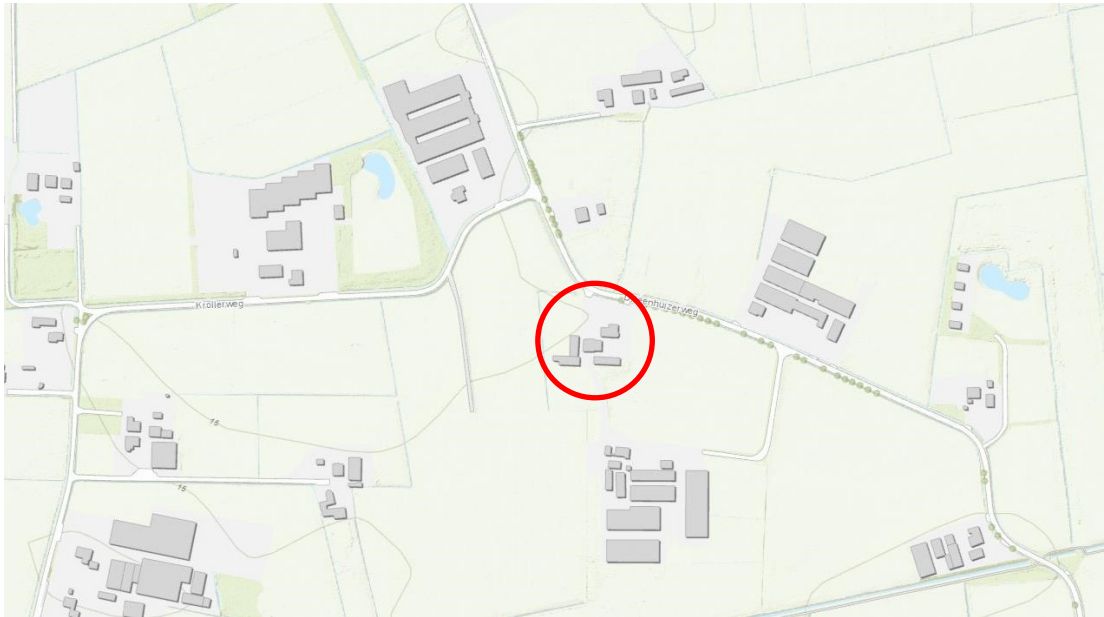
Figuur 1. Ligging plangebied aan de Drieënhuizerweg 23bis te Kootwijkerbroek (rode cirkel).