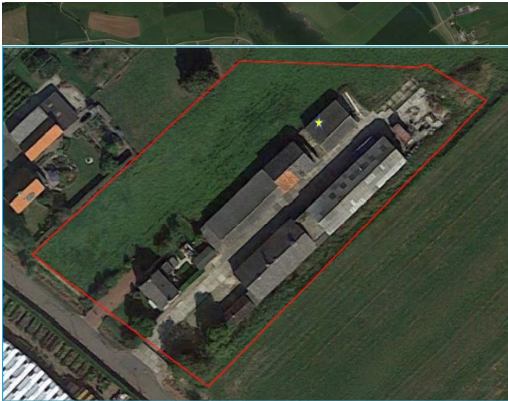
Figuur 1. Situering projectgebied (rood kader) met locatie nest kerkuil (gele ster).