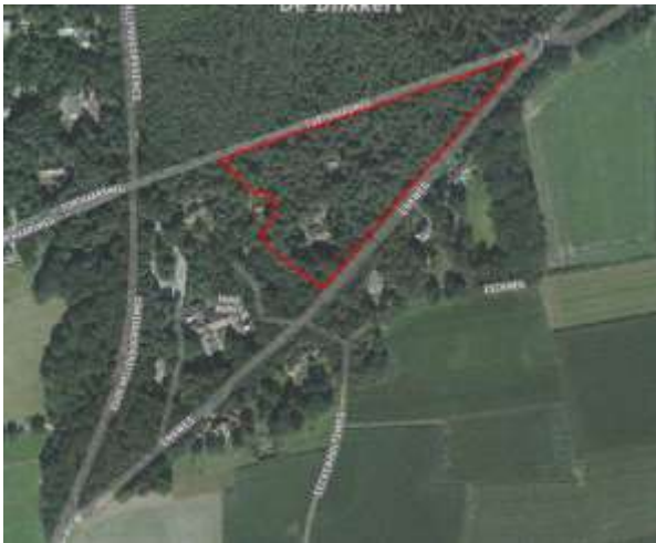
Figuur 1 - Plangebied

Het plangebied ligt ten noorden van de kern Holten, in de overgang van de Holterenk en de Holterberg. Aan de noordzijde wordt het plangebied begrensd door de Forthaarsweg en aan de zuidoostzijde door de Enkweg (zie figuur hierna). Het plangebied bestaat uit een bosperceel met drie gebouwen: een witte villa met twee aangebouwde zelfstandige appartementen en twee bungalows.