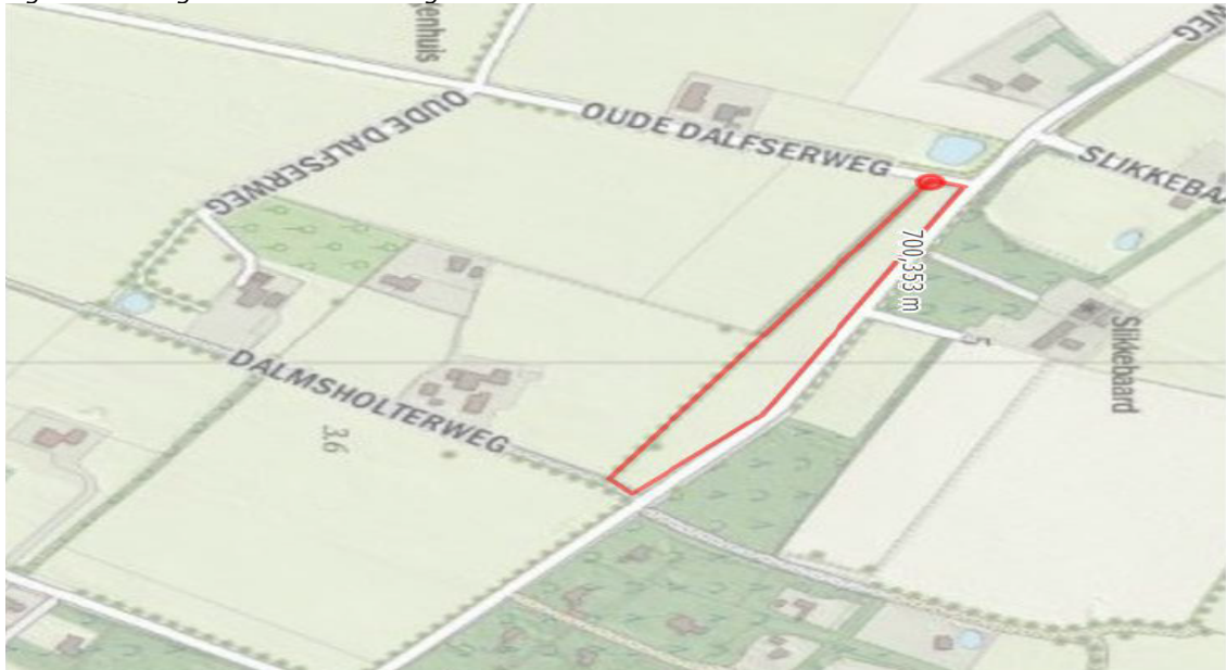
Figuur 1. Plangebied in het buitengebied van Heino.

Aanvrager is voornemens om 0,825 hectare voedselbos aan te leggen op het perceel Heino I 167.