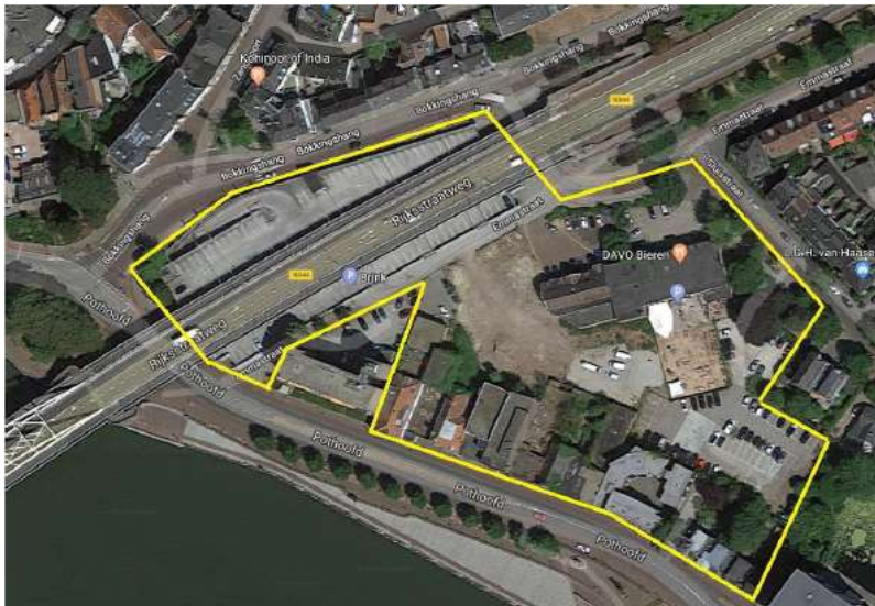
Figuur 1 - Plangebied

In 2017 heeft de gemeenteraad van Deventer gekozen voor een scenario van Behoud & Nieuwbouw voor de verdere ontwikkeling van het gebied. Dit scenario bewaart de cultuurhistorisch waardevolle panden in dit gebied, gecombineerd met nieuwbouw. De Brinkgarage blijft behouden.