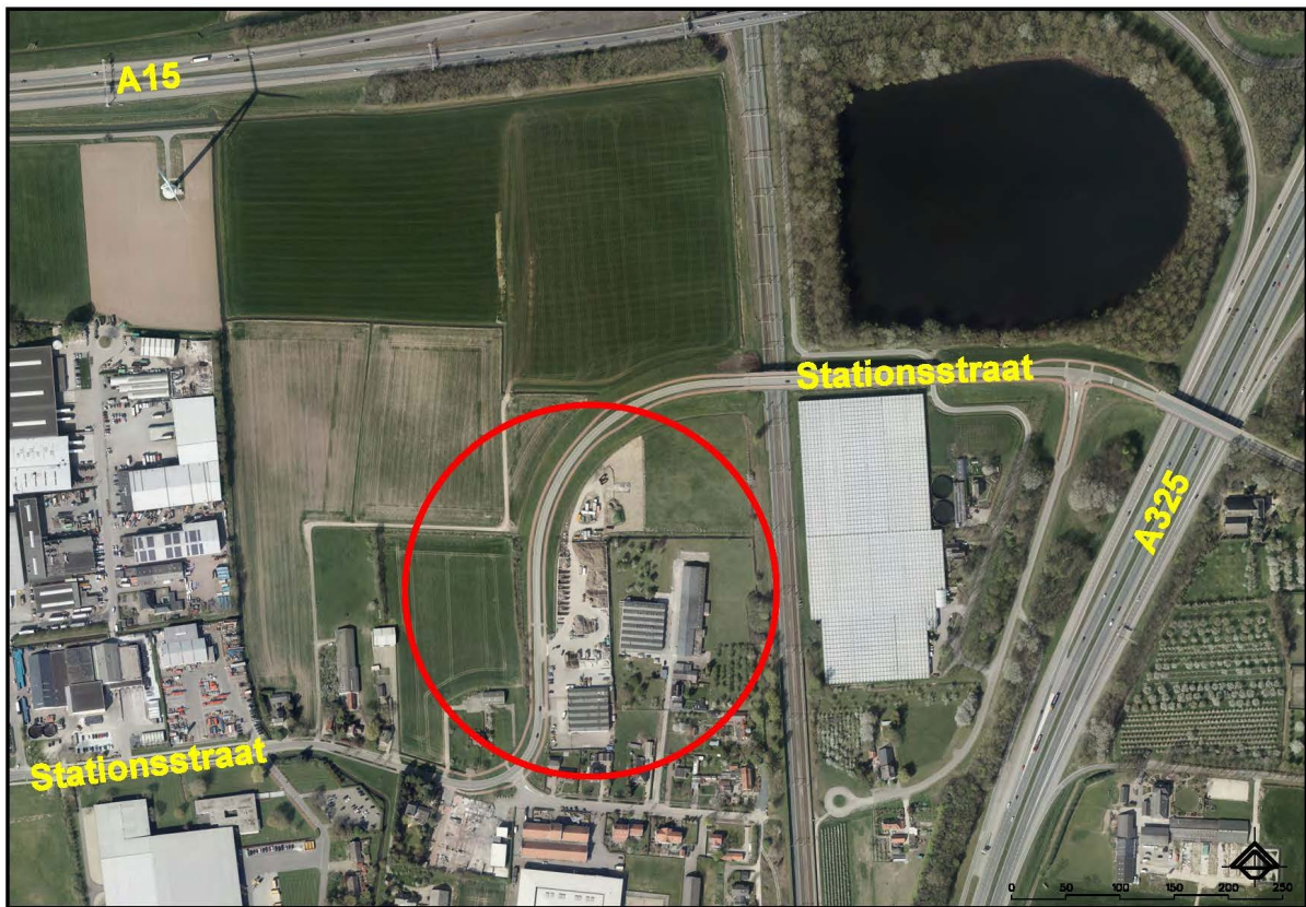
Figuur 1: locatie Stationsstraat 82 in Nijmegen

Namens Aannemers- en Grondverzetbedrijf van Wijk B.V., Stationsstraat 28, 6515 AB te Nijmegen is verzocht om een omgevingsvergunning voor de activiteit "Handelen in strijd met regels ruimtelijke ordening" voor het uitbreiden van haar bedrijfsactiviteiten met een houtshredder op het adres Stationsstraat 82 te Nijmegen.