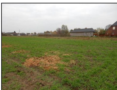
Figuur 3. Onderzoekslocatie ingezaaid met wintertarwe.