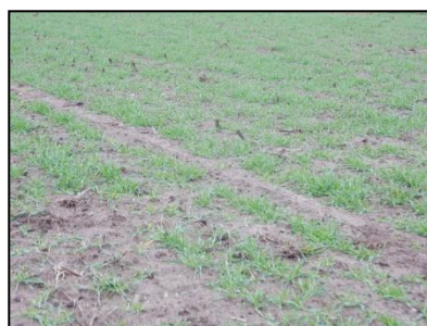
Figuur 4. Aanwezigheid van maisstobben op onderzoekslocatie.