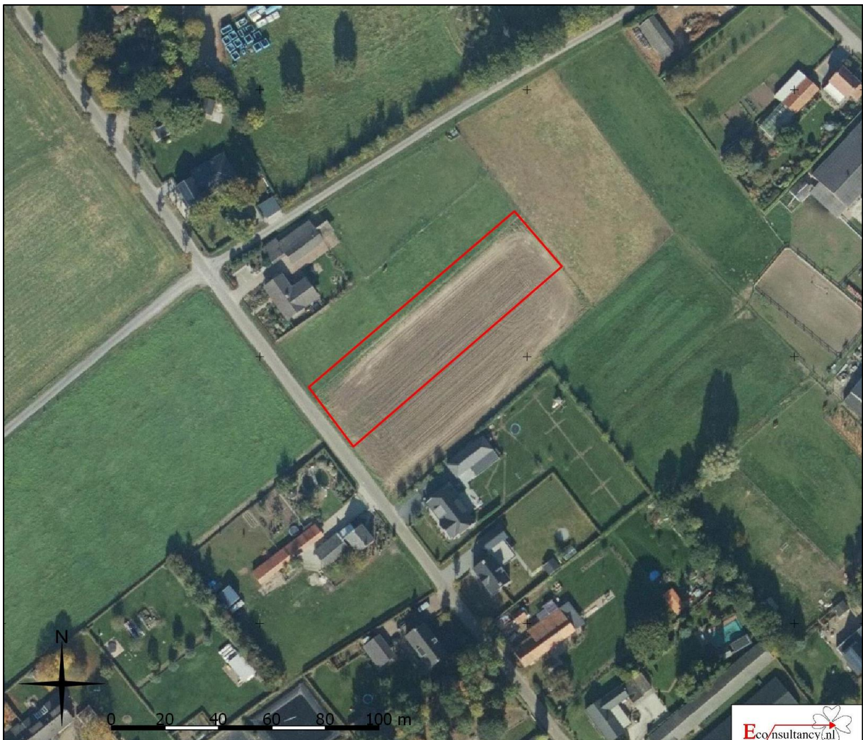
Figuur 2. Luchtfoto onderzoekslocatie en directe omgeving.