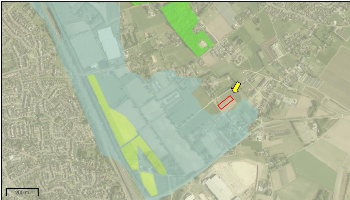
Figuur 8. Ligging onderzoekslocatie ten opzichte van het Natuurnetwerk Nederland (groen) gekleurd.

De onderzoekslocatie maakt geen deel uit van het Natuurnetwerk. De onderzoekslocatie ligt echter wel in de nabijheid van een gebied, behorend tot het Natuurnetwerk Nederland. Het meest nabijgelegen gebied bevindt zich circa 300 meter ten noordwesten van de onderzoekslocatie. Het betreft een gebied dat is aangewezen als Goudgroene natuurzone. In figuur 8 is de ligging van de onderzoekslocatie ten opzichte van het Natuurnetwerk Nederland weergegeven.