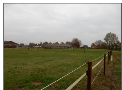
Figuur 5. Omliggende percelen met agrarische bestemming.