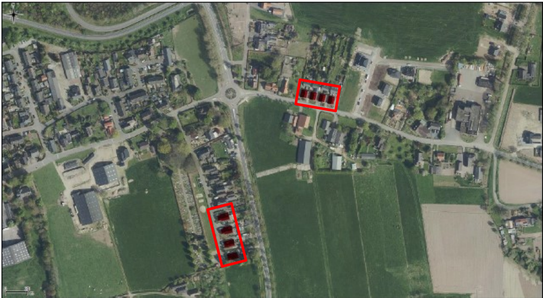
Figuur 1. Ligging en begrenzing plangebied Dorpsstraat 71 t/m 85 (boven) en Het Kruisveld 23 t/m 27 oneven (onder) te Angerlo.