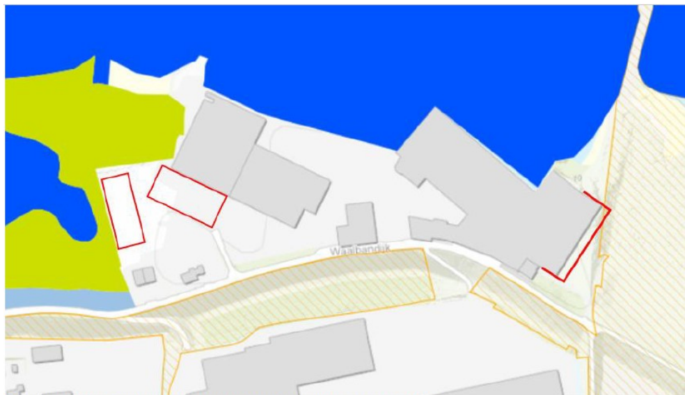
Figuur 4. Ligging nieuwe gebouwen t.o.v. natuurbeheertypen GNN