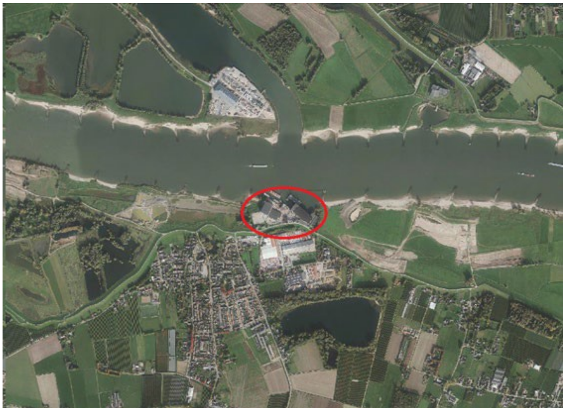
Figuur 2. Situatie werflocatie 2018 in de Waaluiterswaard, grenzend aan project Geertjesgolf