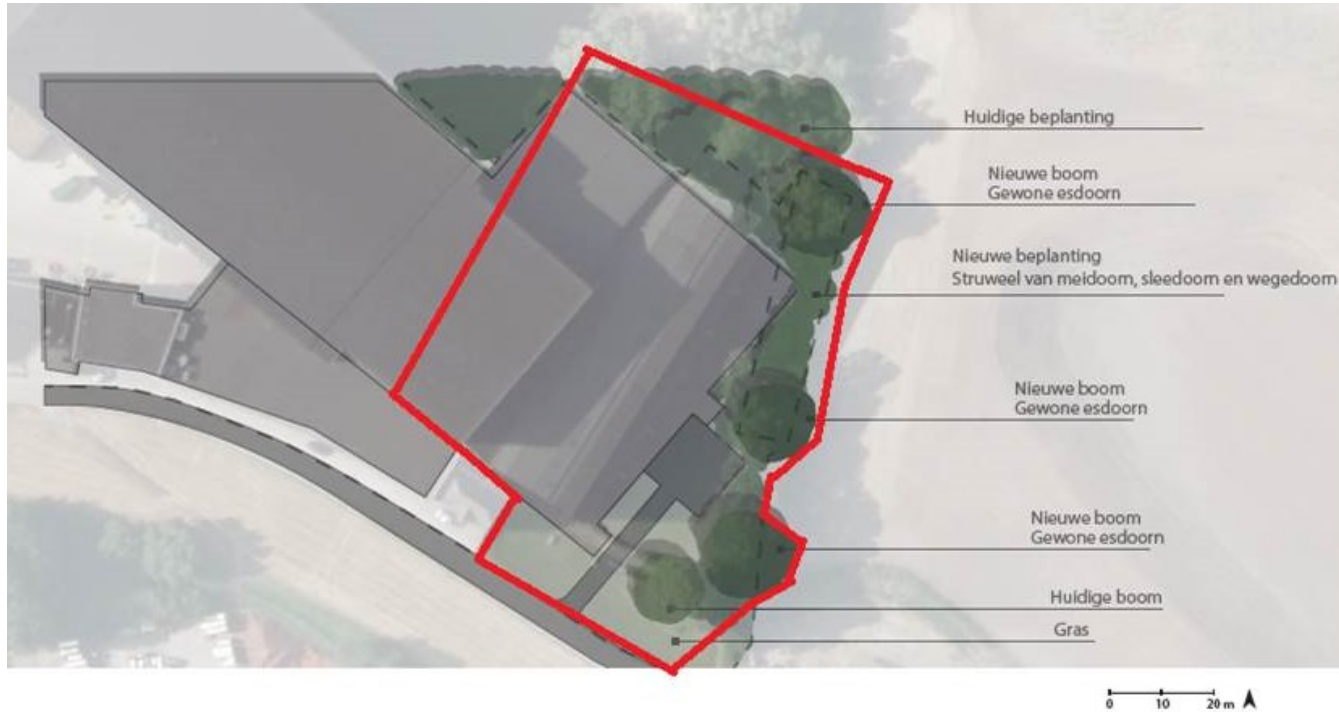
Figuur 3. Begrenzing plangebied in rood