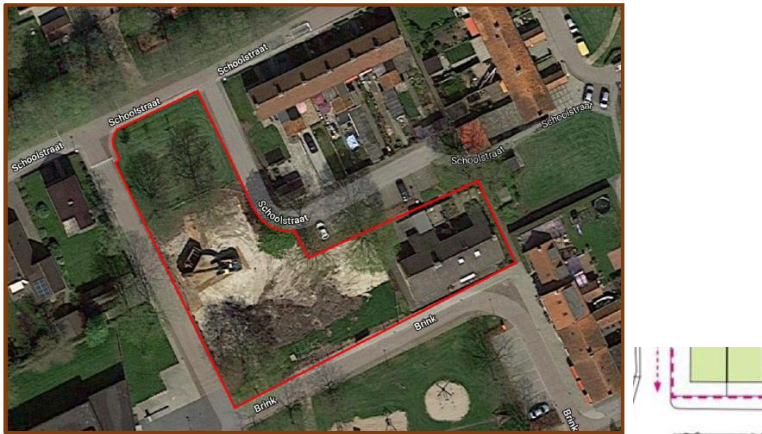
Figuur 1 – projectgebied met de huidige situatie links en de nieuwe situatie rechts