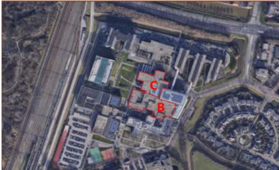
Figuur 1 – Plangebied met gebouw B en C Hogeschool Windesheim