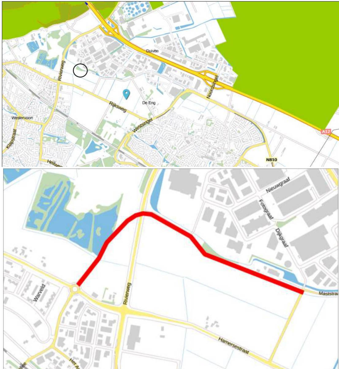
Figuur 1 Ligging (zwarte cirkel) en begrenzing (rode lijn) plangebied.