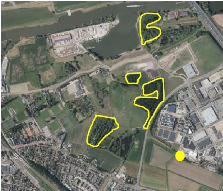
Figuur 1 Alternatieve nestplaatsen voor de buizerd (geel omlijnd) t.o.v. de huidige nestlocatie (gele bol).