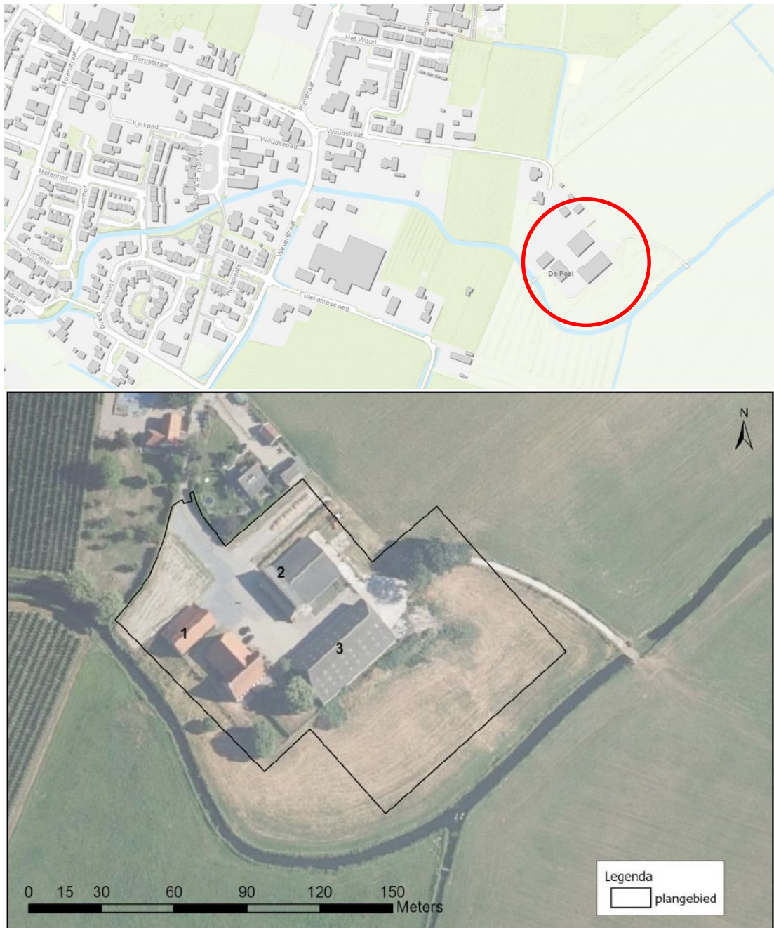
Figuur 1. Ligging plangebied aan de Woudstraat 15 te Ingen (rode cirkel boven) en begrenzing plangebied (onder). De genummerde gebouwen worden gesloopt; de woning blijft behouden.