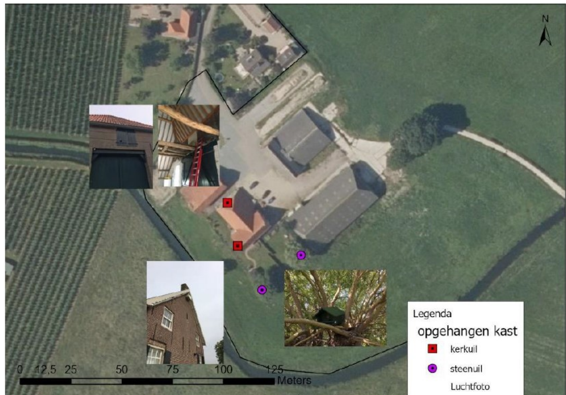
Figuur 3. Locaties alternatieve voorzieningen voor de kerkuil en de steenuil in het plangebied aan de Woudweg 15 te Ingen.